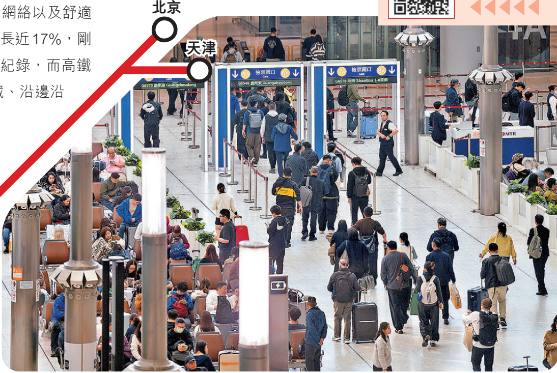
●1月4日傍晚時分，香港西九龍高鐵站出入境的市民與遊客。

區域消費融合，既拉動了觀光、餐飲、住宿等即時消費，又加快了商品、服務的流通效率，促進居民消費升級，為內需增長提供了持久動力。 他指出，鐵路部門未來五年規劃，是對現有鐵路網絡的「強骨健脈」：一方面聚焦打通戰略通道，補足西部路網短板，讓資源流動的「大動脈」更通暢；另一方面在京津冀、長三角、粵港澳大灣區等城市群加密城際鐵路，讓城市間的要素循環更高效。 而滬渝蓉沿江高鐵項目的建成，將歷史性串聯起長三角、長江中游、成渝三大經濟圈，打造世界級經濟黃金走廊。 ●香港文匯報記者 郭瀚林 北京報道