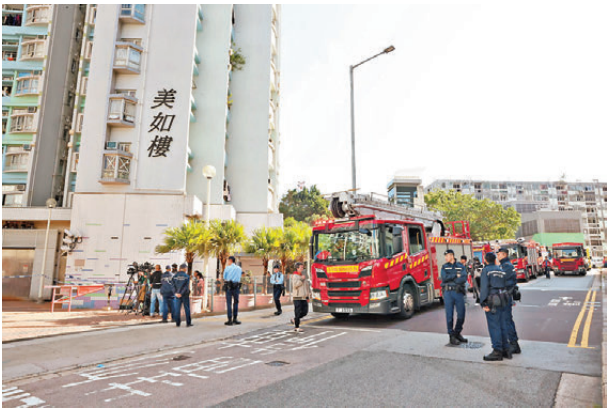
●消防奉召到場。

水，他指出實情是必須打爛火警鐘掣的玻璃，水泵才會運行供水，相信街坊完全不熟悉運作流程而「無水出」。 周先生又稱，火警時他一度開門查看情況，走廊已漆黑一片，伸手不見五指，由於濃煙不斷攻入其單位，因此連忙關門，用毛巾封門隙及報警求助。他形容當時情況緊急，「屋企黑晒，差啲要拉住老婆去窗口攀窗逃生」，但消防處反應迅速，報警後幾分鐘內已趕至登樓協助他們和寵物疏散。今次算是大步檻過，若果「濃煙再勁啲，迫於無奈都要攀窗逃生」。