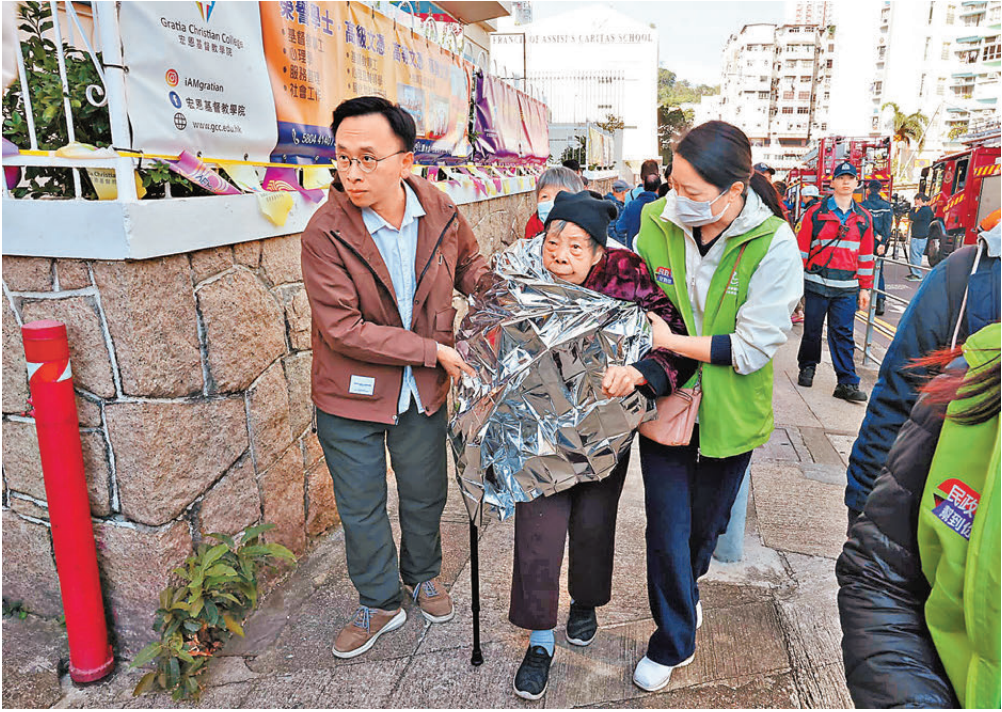
●有疏散到樓下的長者要披上錫紙保暖。