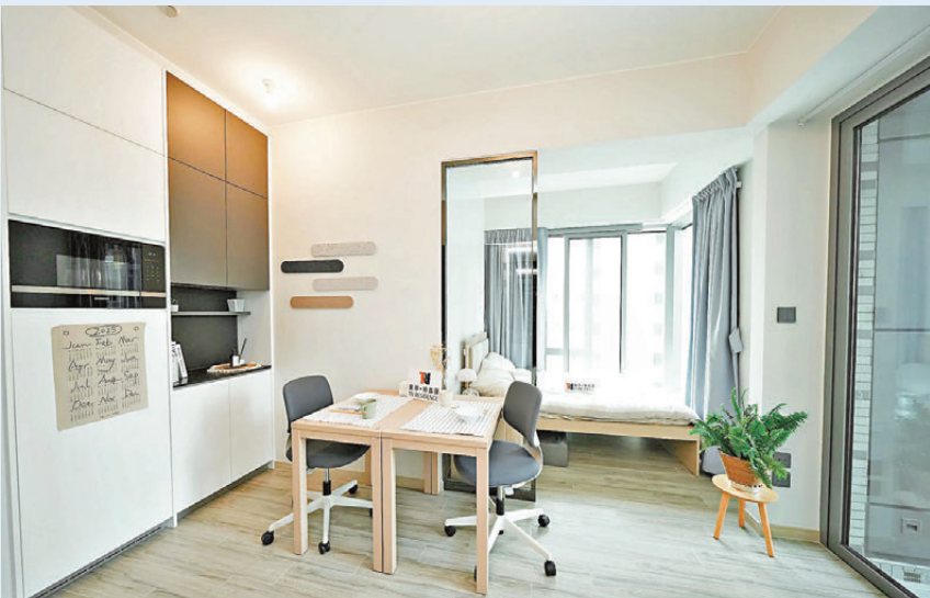
●民青局指，青年宿舍營運者將重啟之前暫緩的青年申請相關青年宿位，繼續為合資格青年人提供自主的生活空間，協助青年發展。圖為青年宿舍內貌。 資料圖片

民青局指，大埔宏福苑火災發生後，局方已透過不同渠道，包括接觸酒店業界、青年宿舍營運者，要求提供緊急住宿單位，協助居民作短期緊急安置。民青局指，特區政府去年12月18日宣布推出業主租金補助，提供每年15萬元協助宏福苑業主解決中長期住宿安排，當時已表示就酒店及青年宿舍的住宿安排，要因應營運者的房間供應。 局方續指，青年宿舍政策原意為輔助青年長遠發展，事實上，這段時間不少宏福苑居民已經遷出或已計劃遷出青年宿舍，在外租住單位或搬到過渡屋，解決中期住宿問題。