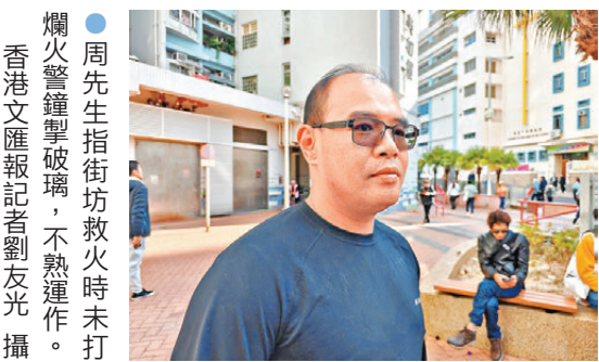
●周先生指街坊救火時未打爛火警鐘掣玻璃，不熟運作。