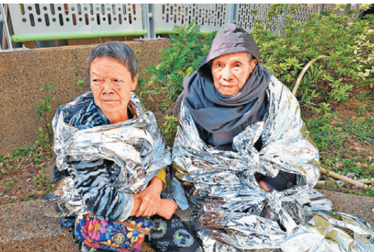
●余太與99歲丈夫由街坊攙扶落樓逃生後，披着錫紙保暖。

水，他指出實情是必須打爛火警鐘掣的玻璃，水泵才會運行供水，相信街坊完全不熟悉運作流程而「無水出」。 周先生又稱，火警時他一度開門查看情況，走廊已漆黑一片，伸手不見五指，由於濃煙不斷攻入其單位，因此連忙關門，用毛巾封門隙及報警求助。他形容當時情況緊急，「屋企黑晒，差啲要拉住老婆去窗口攀窗逃生」，但消防處反應迅速，報警後幾分鐘內已趕至登樓協助他們和寵物疏散。今次算是大步檻過，若果「濃煙再勁啲，迫於無奈都要攀窗逃生」。