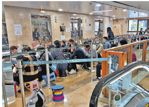
●中午12時半，排隊黨帶備凳子，擠滿電梯大堂。

排隊黨成員介紹，「吸牌」服務需求極大，申請人只要持有香港境外認可地區的駕照，就可免考試直接將境外駕照換成香港正式駕駛執照，由