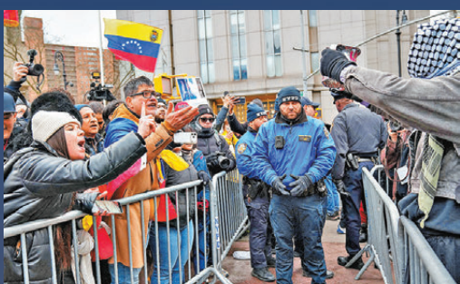
●兩派人士在法院外對罵。法新社

香港文匯報訊 遭美國強行控制並帶至美國的委內瑞拉總統馬杜羅與第一夫人弗洛雷斯，於美國東部時間周一（1月5日）中午12時03分（香港時間周二凌晨1時03分），在紐約南區聯邦地方法院出庭。馬杜羅強調自己仍是委內瑞拉總統，是被美方綁架的戰俘，堅稱自己將獲得自由。