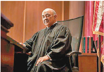
●赫勒斯坦是全美最有經驗的聯邦法官之一。