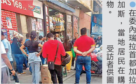
●在委內瑞拉首都加拉加斯，當地居民在購物。

據了解，目前從委內瑞拉飛往中國的航班主要是經古巴、土耳其中轉；還有直飛廣州的航線，途中需在俄羅斯停留加油。阿清估計，後續可能還會有部分華人選擇返回中國，既是為了避開當地可能出現的突發情況，也是想早日回國與家人團聚，以免家人擔心。