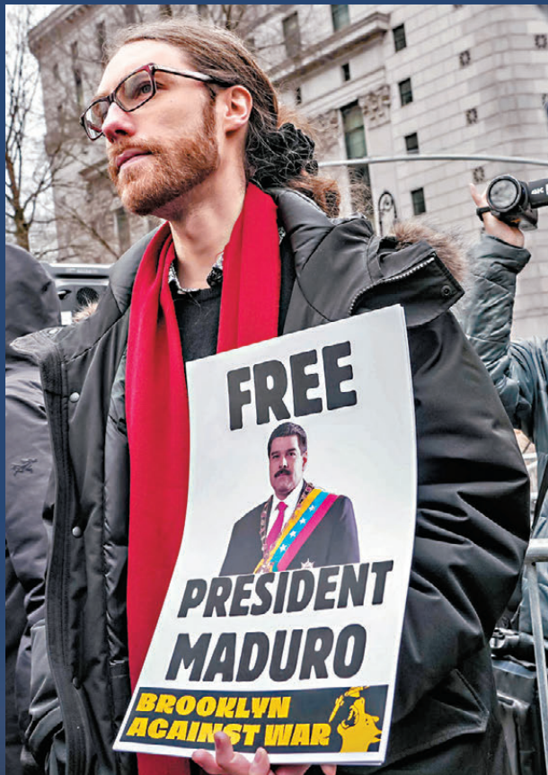
●支持馬杜羅的人士在法院外展示標語。

馬杜羅夫婦當日被全副武裝的警衛，帶離紐約布魯克林的拘留中心，經直升機轉運抵達法院。多間傳媒聚集在法院外，大批執法人員在場維持秩序，現場警戒森嚴。法院大樓內亦有上百名記者和旁聽民眾一早排起長龍，等待經過安檢後進入法庭旁聽。