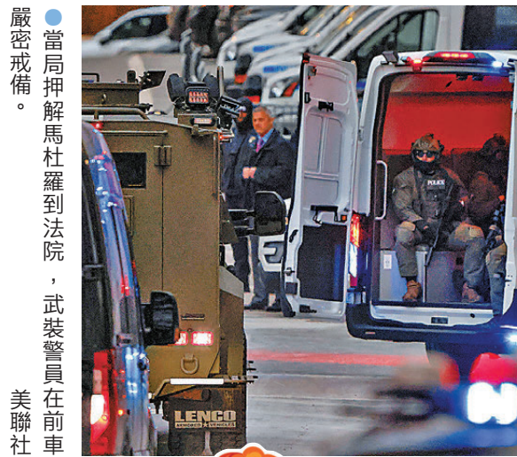
●當局押解馬杜羅到法院，武裝警員在前車嚴密戒備。