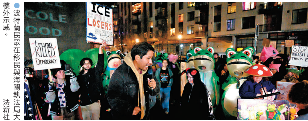
●波特蘭民眾在移民與海關執法局大樓外示威。

香港文匯報訊 美國數十個主要城市上周六（1月10日）爆發遊行示威，抗議移民與海關執法局（ICE）人員在明尼蘇達州明尼阿波利斯市開槍擊斃美國籍女子古德。