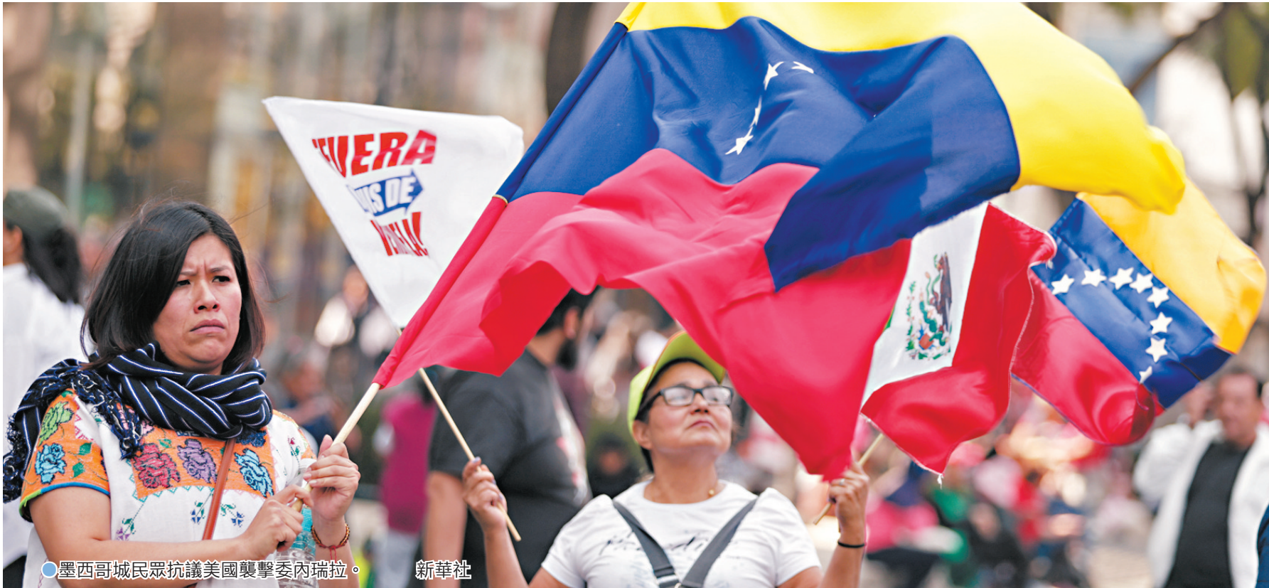
●墨西哥城民眾抗議美國襲擊委內瑞拉。