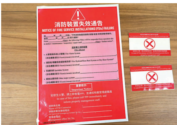
●消防裝置失效模擬通告