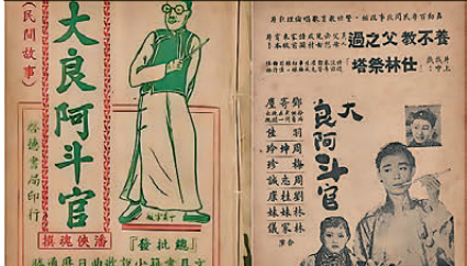
阿爺，我唔啱阿媽去咗個「順德大良三日兩夜美食團」，響美食街食咗大良至出名嘅「雙皮奶」；響遊園大會買咗個雙喜「東方芝士」之稱嘅「大良牛乳」，話人家最喜歡愛嚟返粥嘅，咁咪買咗樽上嚟奉敬你囉！真係有我心！話時話，大良有冇好出名嘅歌後呀，個導遊有冇搵出嚟同大家講呀？有嗎！