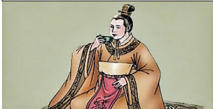
阿斗，你成日飲酒作樂，國事又唔理，成個二世祖咁；點解你老豆劉備打返嚟個江山呀？我就係咁，等佢班友覺得我無能，先至保得住條命仔呀！