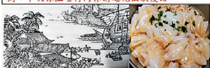
睇呢張圖，暫時「陳村碼頭」真係好繁忙囉！唔怪得陳村碼頭又得又得嘅「陳村粉」嘢！我只係知「雙皮奶」又得又得嘅「陳村粉」嘢！陳村唔止粉出名，逢賭都好出名；不過，我想講嘅係「陳村碼頭——逢賭必啱」呀！