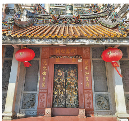
●筲崗老圍的「何真祠」。

這是一片開發建設的熱土，但鐵軌與倉庫的冷峻，摩天大樓的豪華，都掩不住萬米蓮塘帶來的鮮活。洪湖公園是一個以荷花為主題的市民公園，南北貫穿筲崗街道。公園總面積近60萬平方