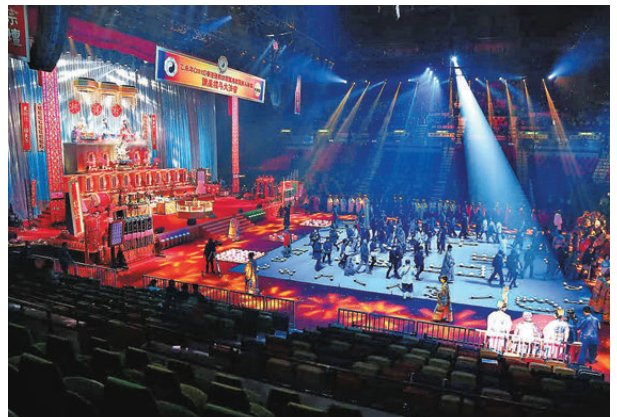
●2015年，齋色園於香港體育館舉辦「萬人祈福讚星禮斗大法會」，為香港首個於紅館舉辦科儀的道教團體。

其實，善信進入廟宇祈福，不論是否「犯太歲」，皆可向太歲及諸星神禮拜，祈求吉星照臨、元辰光彩。在本園太歲元辰殿內，信仰與科技交融，殿中布滿星斗文化元素。善信參拜時，宜先禮斗姥元君，次拜值年太歲，最後誠心祈求本命太歲，亦可請道長「上表祈福」，或供奉「三台九皇星燈」「牡丹供燈」，藉此善行，感格星天，福佑綿延。