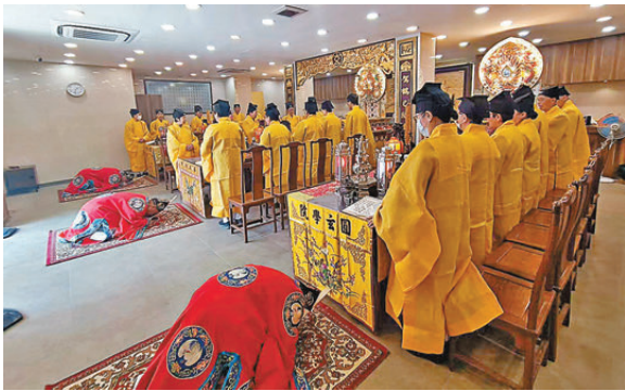
●荃灣圓玄學院昨日舉行法事，超度大火罹難者。