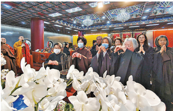
●善信為大火罹難者誠心上香。