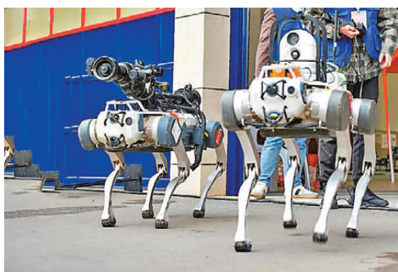
●新一代消防機械狗救災技術邁向主動攻堅與偵察融合。

其中，滅火狗具備機動性與滅火效能，噴灑角度最大120度，水平旋轉30度，可精準打擊不同方位火點，能使用水或泡沫作為滅火介質，是火場中的先頭部隊，利用智能水炮壓制明火，開關安全窗口。另外，它憑藉四足卓越的越障能力，在狹窄、