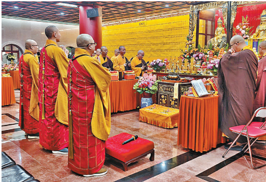
●荃灣西方寺舉辦「四十九天誦經超度法會」圓滿，為大埔宏福苑火災所有罹難者及傷者致以誠懇的迴向及祝福。

香港文匯報訊（記者 張茗）大埔宏福苑火災發生至昨日共49天，即俗稱的「尾七」，荃灣西方寺自火災發生首天（去年11月26日）至昨日舉辦49天誦經超度法會，祈願佛力庇祐，亡者早生淨土，離苦得樂；傷者早日康復，重建家園。參加善信踴躍，齊誦經典，同心祈禱，至誠迴向。為此，西方寺住持寬運大和尚特於是次49天法會圓滿之際，為所有火災罹難者及傷者，致以誠懇的迴向及祝福。