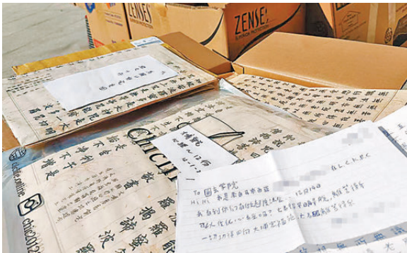
●有海外華人手抄心經，盼讓逝者安息、讓生還者釋懷。