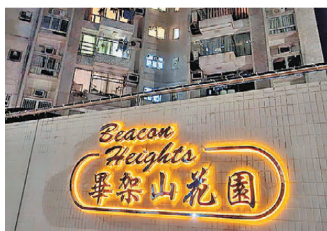
●畢架山花園

警方經調查，認為案件無可疑，列作有人從高處墮下案，交由長沙灣警區雜項調查隊跟進。