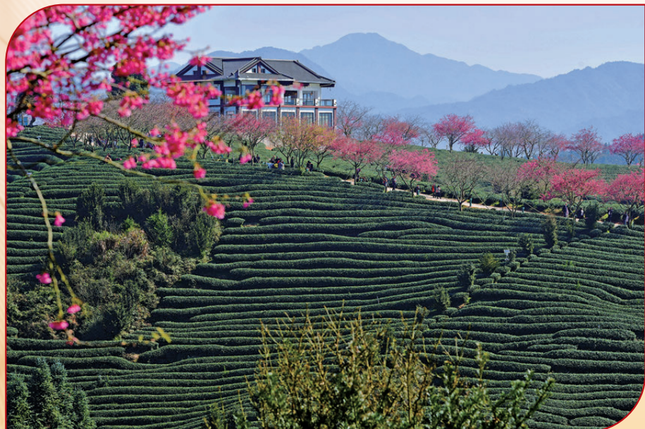
●推進農業農村現代化，必須緊扣國情農情。

第三次農業普查資料顯示：我國小農戶數量佔農業經營戶總量的98%，小農戶從業人員佔農業從業人員的90%。