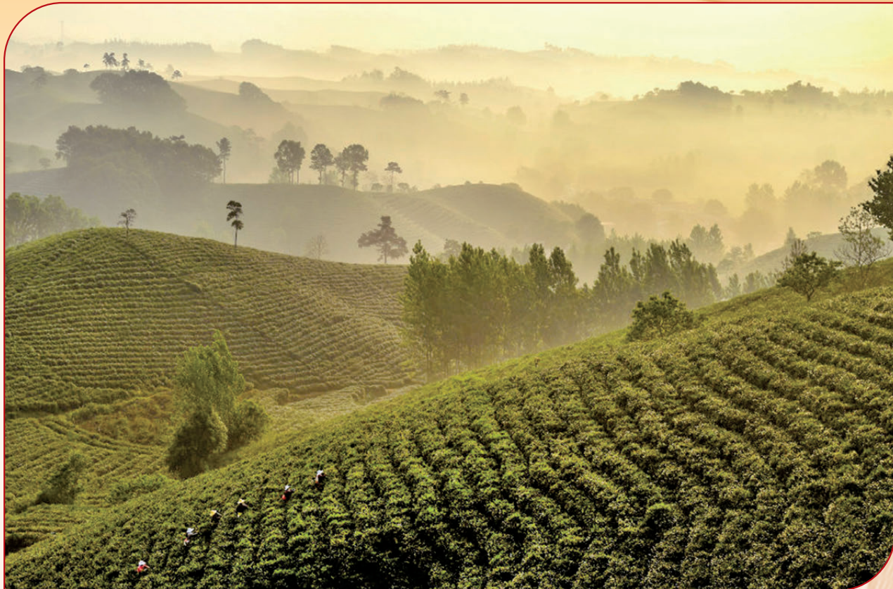
●農村改革已走過40餘年歷程。

香港文匯報·人民政協專刊綜合報道 以家庭承包經營為基礎、統分結合的雙層經營體制，是我國農村基本經營制度，更是我們黨的農村政策的基石。黨的二十屆四中全會再次明確提出要穩定土地承包關係、發展農業適度規模經營等，為新時代在更高層次上鞏固和完善農村基本經營制度提供了根本遵循與行動指南。早前，全國政協召開雙周協商座談會，部分全國政協委員、專家學者及新農人代表圍繞「鞏固和完善農村基本經營制度」主題深入協商建言，為推進鄉村全面振興、加快建設農業強國增動力、添活力。