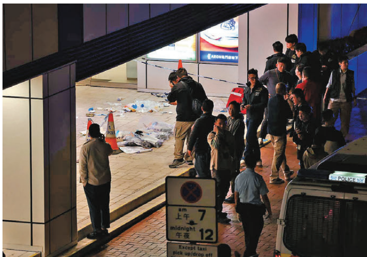
●警方封鎖現場調查。

警方新界北總區刑事部高級警司鍾麗詒講述案情指，疑犯有黑社會背景，有與毒品案件相關的案底。由於他身上有毒品，不排除他受毒品影響而犯案，至於其家人所說其有精神病，警方會進一步了解。為了營救女途人，兩名警員一再警告無效，繼而各開一槍，醫生在死者身上找到一粒彈頭，另警方在現場外牆發現一個彈孔及兩枚彈殼。警方翻查閉路電視後，相信疑犯無同黨。屯門警區副指揮官高級警司黃浩瀚強調，警隊對警員使用槍械有嚴格指引，新界北衝鋒隊人員因事件的嚴重性，選擇即時戰術性介入，在沒有其他選擇下使用槍械，並拯救了無辜女途人性命，疑犯亦是身體最大部分中槍，警員絕對符合使用槍械要求。