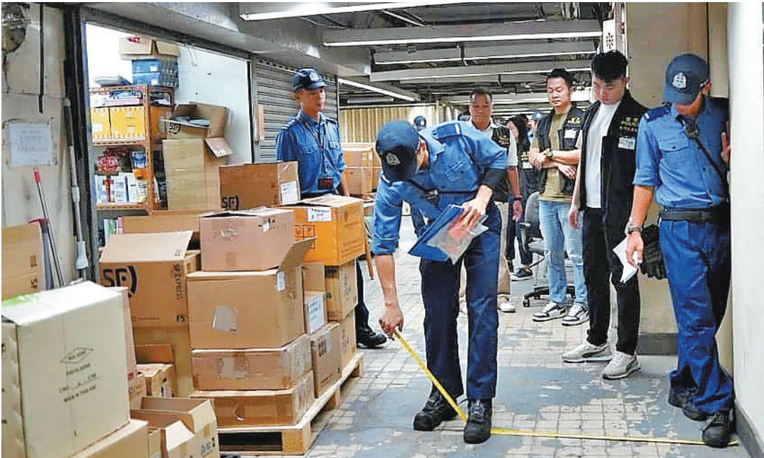
●圖為消防處人員前年在聯合行動中巡查多幢工業大廈，並就各項消防隱患及違規情況採取相應資料圖片

曾有報道指消防員離開後，防煙門又繼續被人打開。然而，消防人員總不能天天在處所站崗，局方希望透過住客關心自己住處安全的自發性，提高防火意識，減低發生火災的機會。