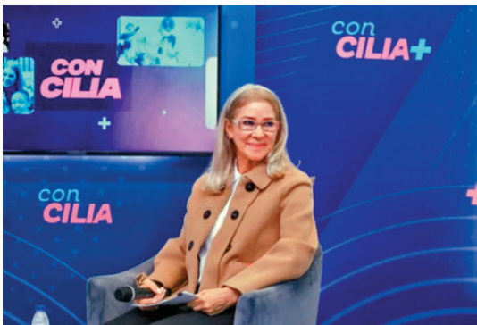
●馬杜羅的妻子西莉婭·弗洛雷斯常被稱為「第一戰士」。

羅的親生兒子格拉現年35歲，23歲步入政壇，27歲當選議員。弗洛雷斯有三個孩子，均與身為警長的前夫所生。