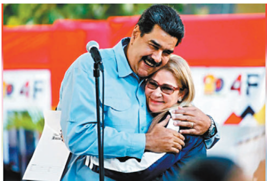
●馬杜羅與妻子西莉婭·弗洛雷斯