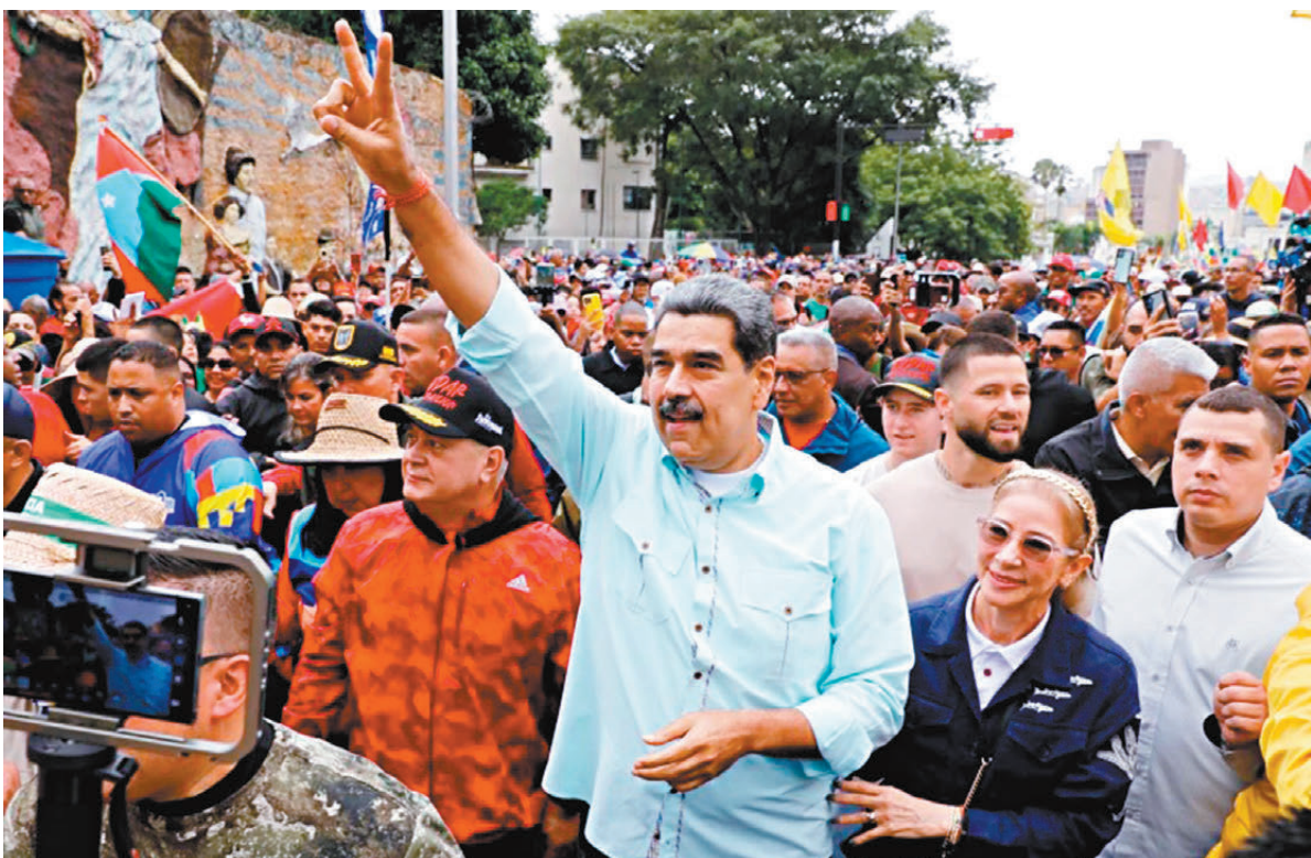
●馬杜羅與他的支持者參與民眾集會。

弗洛雷斯於2015年創建Twitter（現為X）賬號，在最初的個人簡介裏，她寫着「查韋斯的女兒」，後來改為「查韋斯主義者」。近年來，弗洛雷斯更多以母親形象出現，並與公眾建立聯繫。2018年，弗洛雷斯與其他13名官員一起受到加拿大的制裁。幾個月後美國也加入制裁行列，並在新聞稿中說，馬杜羅「依靠其核心圈子來維持權力」。對此，馬杜羅宣稱：「想攻擊我就攻擊我，別惹西莉婭，別惹我的家人。別當懦夫。她唯一的罪過就是我的妻子。」據報道，弗洛雷斯與馬杜羅沒有生小孩。馬杜