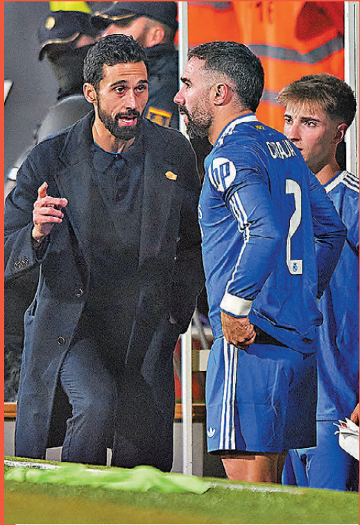
●艾比路亞(左)名氣不足，難令皇馬群星信服。