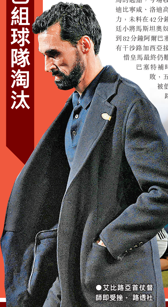
●艾比路亞首任主帥即受挫。