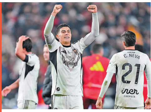
▲乙組阿爾巴塞特以弱勝強，全隊賽後瘋狂慶祝。

西班牙16強對手只是在乙組為護級掙扎的阿爾巴塞特，艾比路亞以為能以一場輕鬆勝利作為自己執教皇馬的起點，今場收起基利安麥比、祖迪比寧威、洛迪高斯及曹亞文尼等主力，未料在42分鐘先失一球，幸有阿根廷小將馬斯坦奧奴半場前追成1:1，到82分鐘阿爾巴塞特再次領先，皇馬亦有干沙路加西亞接應角球頂入扳平，可惜皇馬最終仍難逃出局命運，被阿爾巴塞特補時階段絕殺以2:3落敗，五年來首次在西班牙盃被低組別球隊淘汰，艾比路亞亦成為繼2018年