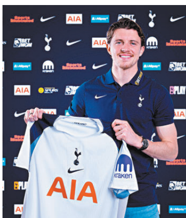
●加歷查加盟熱刺，成隊史第11貴收購。

在干拿加歷查完成交易後，英媒指自2019年11月普捷天奴下課以來，熱刺的轉會費總支出高達9.79億英鎊，在Big6球隊中排名第四，超過目前英超榜首的阿仙奴以及衛冕冠軍利物浦，但他們目前僅排名第14位。