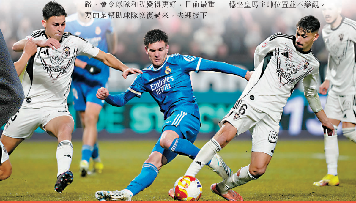
●皇馬(藍衫)五年來首次在西班牙盃遭低組別球隊淘汰。