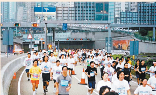
●在各組織做好準備和善後工作下，比賽才能舉行。 公開圖片

他強調所有工序須於短時間內完成，以確保賽道相關路段於下午約1點30分全面恢復通車並交通順暢：「我們目標是做到讓渣馬這場盛事從未擾亂這座城市的日常運作。」