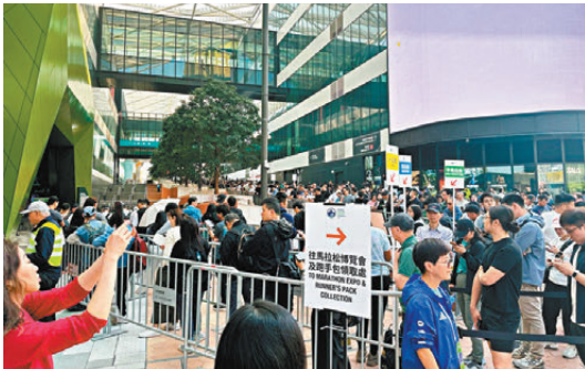
●大量選手排隊領取跑手包。

則形容今次渣馬是自己今年最重要的一仗：「老實說目前來看參加亞運會的希望不是很大，但想透過今次渣馬去檢驗自己能力，如果發揮得好未嘗不是沒機會去挑戰看看。」他表示自己去年最大的得着是學會調整心態，「我會盡量以平常心去面對，冷靜地分配體能，不要讓自己太過興奮，希望總排名能夠提升。」