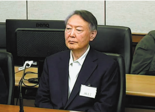
●尹錫悅在法院聽取判刑。 網上圖片