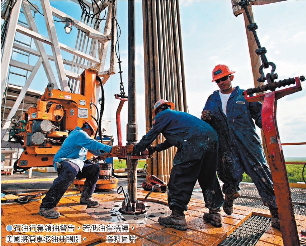
●石油行業領袖警告，若低油價持續，美國將有更多油井關閉。 資料圖片