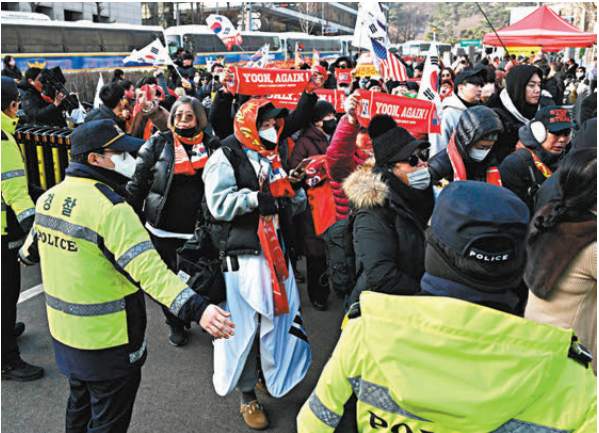
●尹錫悅支持者在法院外抗議。

尹錫悅目前身陷8宗刑事訴訟，今次是首次宣判，庭審現場由媒體轉播。尹錫悅將繼續就其餘7宗案件受審，其中最關鍵的尹錫悅涉嫌帶頭發起內亂案一審，將於下月19日宣判，獨立檢察組日前已就此案要求判處尹錫悅死刑。