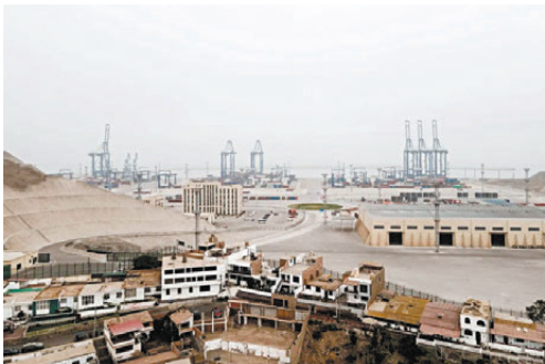
●卡亞俄是秘魯最重要海軍基地。

美國與秘魯長期保持安全合作關係，秘魯國會此前已授權美軍在當地駐留。美國總統特朗普政府一直誓言要將拉美「排除在其他大國之外」，視該地區為美國勢力範圍。