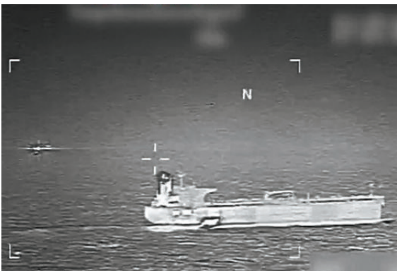
●美軍扣押俄羅斯公司營運的油輪「韋羅妮卡號」。

此外，美國石油生產商同時面臨成本上漲問題，特朗普的關稅政策推高採油所需材料成本。分析認為，減少汽油支出意味着消費者可將更多錢花在其他方面，從而促進經濟增長，但對消費者的提振只是經濟情勢一部分，如今美國已成為石油淨出口國，油氣投資對經濟貢獻巨大，消費者因低油價增加的支出，可能被石油業投資銳減所抵消，對整體經濟提振作用有限。