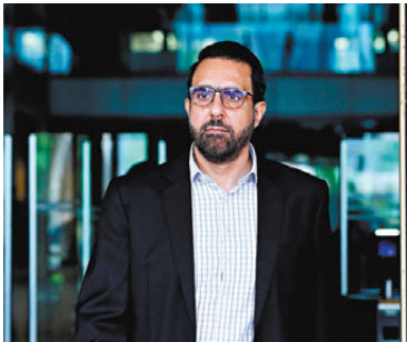
●畢丹星被撤除國會反對黨領袖職務，但仍保有國會議員身份。

新加坡於2020年首度設置國會反對黨領袖職務，畢丹星是新加坡歷來首名獲總理正式委任的國會反對黨領袖。儘管畢丹星被撤除職務，但仍保有國會議員身份。