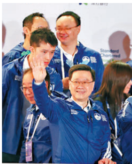
●行政長官李家超昨日清晨主持全馬起步禮。