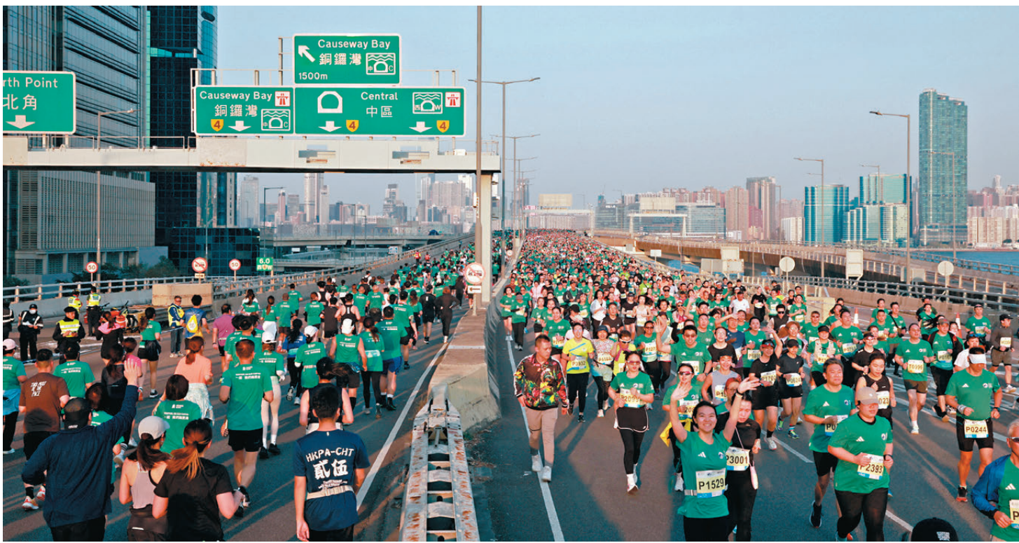
●大批跑手在東區走廊面向維港的景致中跑步。