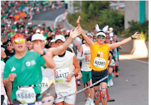
●有跑手對參與是次馬拉松盛事十分興奮。