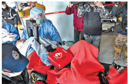
●有跑手送院時昏迷，要用自動心外壓機急救。