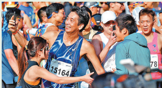
●川內優輝賽後成為跑手的「打卡點」。香港文匯報記者郭正謙攝

衝線後，他一度站立不穩狀甚痛苦，需要工作人員和經理人攙扶到休息區。他坦言渣馬「魔鬼賽道」之名果然名不虛傳：「賽道有很多上斜和落斜，要經過三橋三隧真的很辛苦，特別是風勢十分大，不容易保持速度，整條賽道非常特別。」不過令他留下最深印象的卻是比賽的人情味，他大讚香港市民和跑手都十分「friendly」：「每次來港都能感受到香港跑手的友好，無論是比賽前或後都會為我打氣，這亦是我今次參加渣馬的原因，亦希望未來有時間可以再挑戰渣馬。」