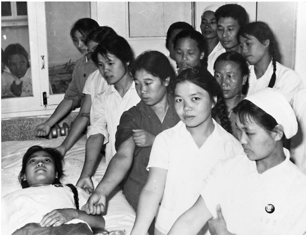
●當年踴躍為越南傷員獻血的桂林南溪山醫院醫護人員是「流動的血庫」。

香港文匯報記者近期走訪廣西兩處舊址，在越南抗法、抗美援朝鬥爭中，在這個毗鄰越南的中國西南省份，守望相助的故事至今珍藏在兩國人民的心田，是「中越關係的根基在人民、血脈在人民、力量在人民」的寫照。