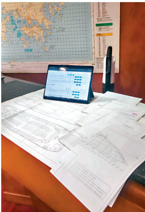
●電子驗船平台與紙本文件。