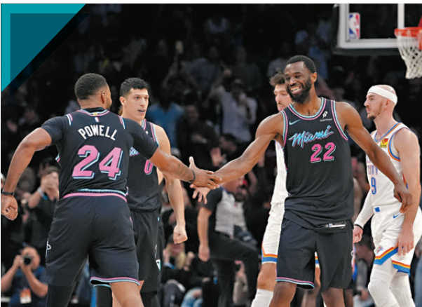
●安祖域堅斯（右）在射入關鍵三分球後慶祝。