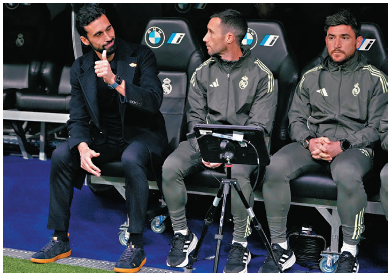
●艾比路亞（左）以一場勝仗慶祝生日。

值得一提的是，麥巴比今場攻入其職業生涯第412球，超越亨利的411球成為法國史上入球第二多球員，僅次於賓施馬（513球）。