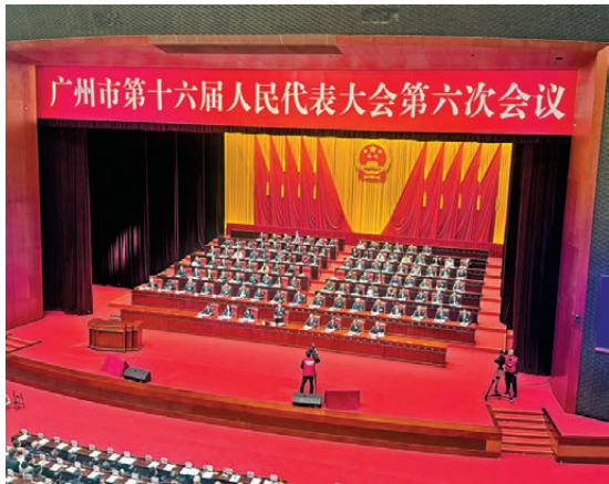
●廣州市十六屆人大六次會議昨日開幕。

今年為「十五五」開局之年，廣州已錨定粵港澳大灣區核心引擎功能謀篇布局。昨日開幕的廣州市十六屆人大六次會議上，廣州市市長孫志洋在政府工作報告上明確指出，今年廣州將推動南沙探索與香港創新更緊密的合作模式，謀劃建設粵港合作區；加強與香港北部都會區聯動合作；以及打造穗港馬產業深度合作區、辦好賽馬賽事等。有香港馬圈中人指出，香港特區與廣州一直透過從化馬場拓展馬產業鏈，相信將來可進一步加強合作，同時將檢疫等模式擴展至大灣區其他城市。今年10月31日將於從化馬場上演的速度賽事，可進一步促進穗港兩地的旅遊發展。 ●香港文匯報記者 李紫妍、帥誠、聶曉輝