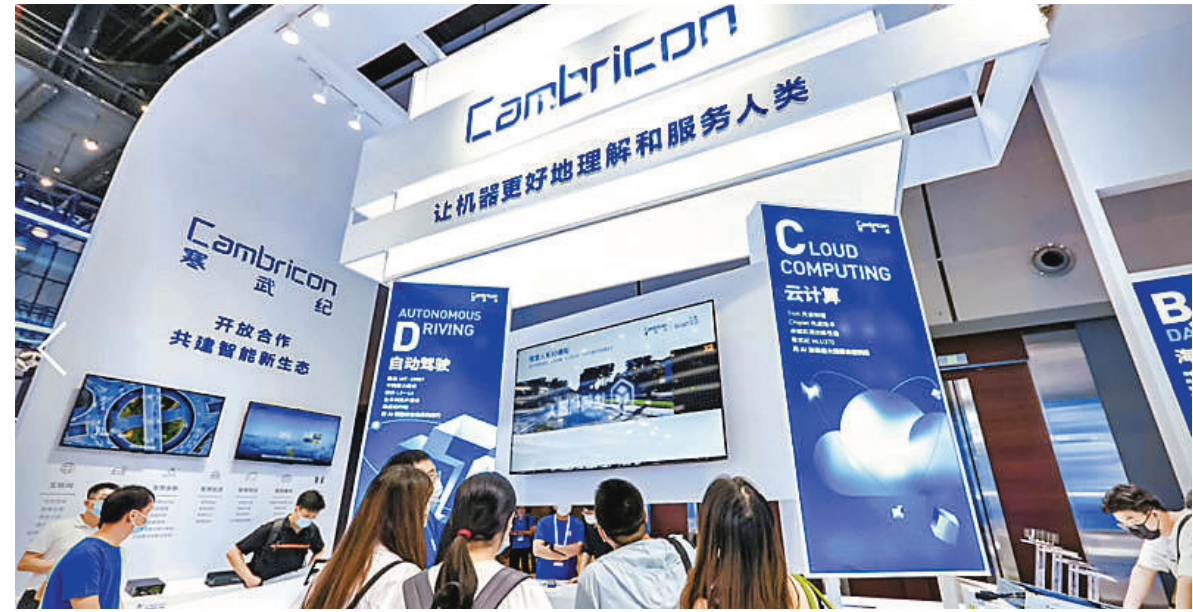
●胡潤中國AI十強，芯片企業佔七席，寒武紀居榜首。圖為早前寒武紀展出的新技術。

「2025年，中國AI的地位正在顯著增強。」胡潤說，2025年初，DeepSeek以顛覆性的性價比橫空出世。2025年末，問世僅9個月的Manus被Meta收購，這是Meta自成立以來的第三大併購。他指出，過去一年裏，第三方AI模型聚合平台OpenRouter記錄了100萬億個token的使用數據，結果顯示：2024年末時中國開源模型的市場份額最低僅1.2%，此後顯著增長，最高時佔比接近