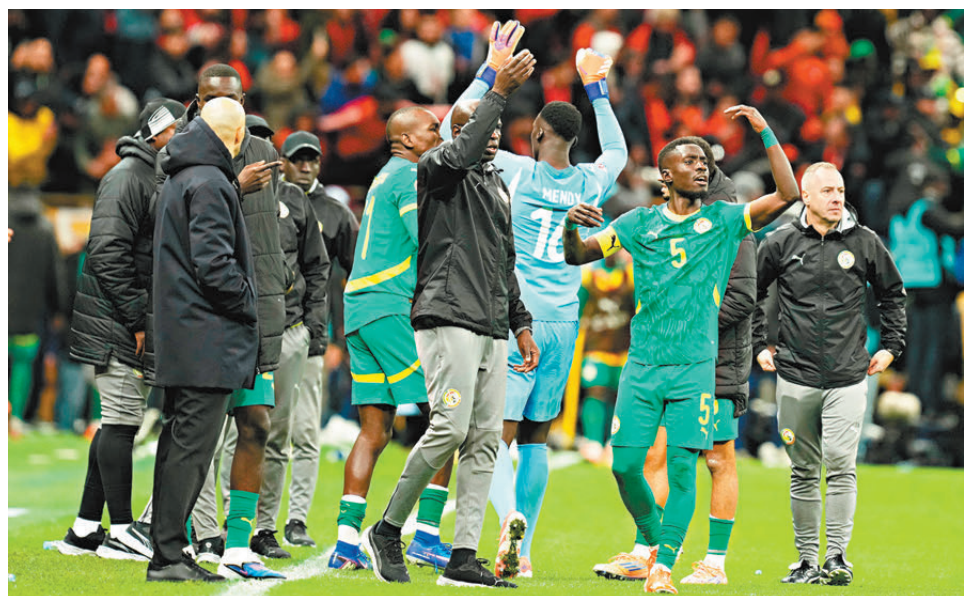
● 塞內加爾一度以罷踢抗議球證執法水平。

對於塞內加爾曾一度罷踢，利加基指是羞恥的行為，「全世界人都在看，比賽暫停超過10分鐘並不體面，他們呈現了丟人現眼的非洲足球形象。」