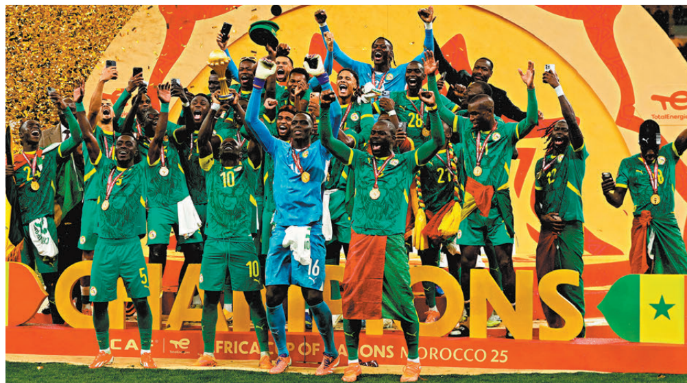
● 塞內加爾球員在頒獎儀式上。