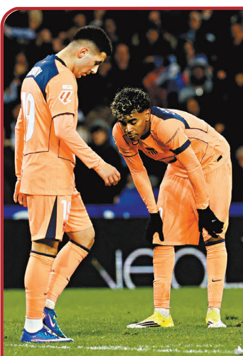
● 巴塞球員難掩失望。