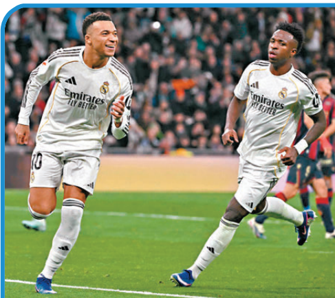
● 傷癒的麥巴比(左)狀態不俗。