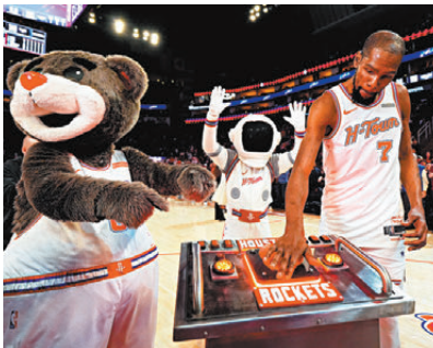
● 杜蘭特升上史上得分榜第六位。

杜蘭特指榮幸能與魯域斯基相提並論，「這對我意義重大，他是我一直仰望的對象，也是我生涯中實際對戰、每天都在關注的球員。能與這些偉大的名字並列，我心懷感激。」