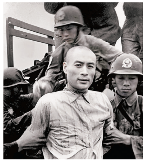
●聶曦臨刑前照片，雙手反縛，卻昂首挺胸，目光堅定，盡顯英烈氣概。

一張黑白照片，定格了33歲的青春與信仰。雙手反縛，白衣挺立，目光沉靜而堅定——那是聶曦烈士留在人間最後的影像。七十餘載沉默之後，這段曾「不能說」的往事，終於由他的後代黃怡然娓娓道來，「我要講給所有人聽。」 聶曦，原名聶能輝，1917年出生於福建閩清。青年時期考入海軍陸戰隊講武堂，1937年投身抗日戰場，在烽火歲月中結識了影響其一生的吳石將軍。抗戰勝利後，面對國民黨當局發動內戰造成的社會動盪與人民苦難，吳石將軍毅然選擇秘密為中國共產黨工作。聶曦作為吳石最信任的學生，義無反顧選擇追隨恩師。 在這條九死一生的道路上，聶曦冒着生命危險將298箱國民黨絕密檔案安全轉移至大陸，親自攜帶重要情報遠赴香港轉交組織，為革命事業立下不可磨滅的功勳。赴台前夕，他囑咐家人，「以後孩子可以改姓。」一句話，道盡訣別之意，也映照出他對信仰的決絕。 1950年，因叛徒出賣，聶曦與吳石、朱楓、陳寶倉相繼被捕。在獄中，他們遭受嚴刑拷打卻始終堅貞不屈。就義前那張照片中，33歲的聶曦身着白衫，雙手反縛，卻昂首挺胸、目光堅定，盡顯英雄氣概。 黃怡然表示，「英烈們為了祖國的統一和民族的復興，不惜拋頭顱、灑熱血。他們的遺志，就是我們今天的奮鬥目標。期盼祖國早日統一。」