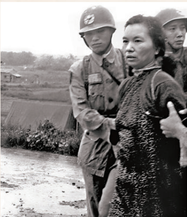
●朱楓烈士就義前的一幕。

和所有先輩先烈們一樣，把民族大義放在了個人安危之前，以忠貞的黨性和堅定的革命思想鑄成了無堅不摧的盔甲。」這位從東海之濱走出的巾幗英雄，用她45年的生命歷程告訴我們：真正的榮耀，往往隱藏在沉默的堅守中；最偉大的忠誠，是對信仰至死不渝的追隨。 1951年7月11日，上海市人民政府向朱楓家人發放革命烈士家屬光榮紀念證書。1983年6月1日，國家民政部批准朱楓為革命烈士並特發革命烈士證明書以資褒揚。2010年，在兩岸共同努力下，朱楓烈士遺骨終於回歸故土，安葬於故鄉鎮海。2025年，正值她誕辰120周年、犧牲75周年之際，國家安全機關在全國多個教育基地開展系列紀念活動，數萬人走進朱楓故居與陵園，聆聽那段沉默卻滾燙的歷史。