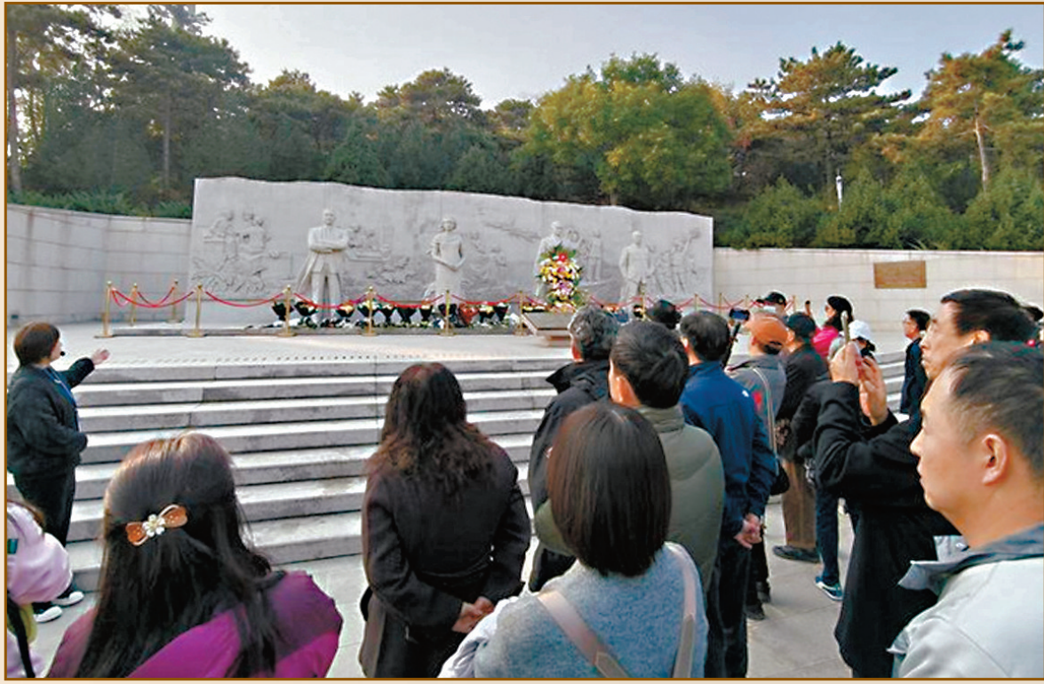
●北京西山的無名英雄紀念廣場上矗立着吳石、朱楓、陳寶倉、聶曦四位烈士的雕像，群眾自發前來祭拜。