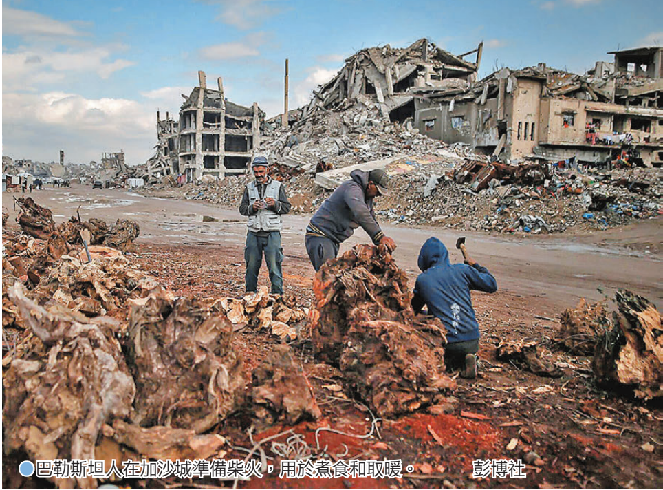
●巴勒斯坦人在加沙城準備柴火，用於烹食和取暖。