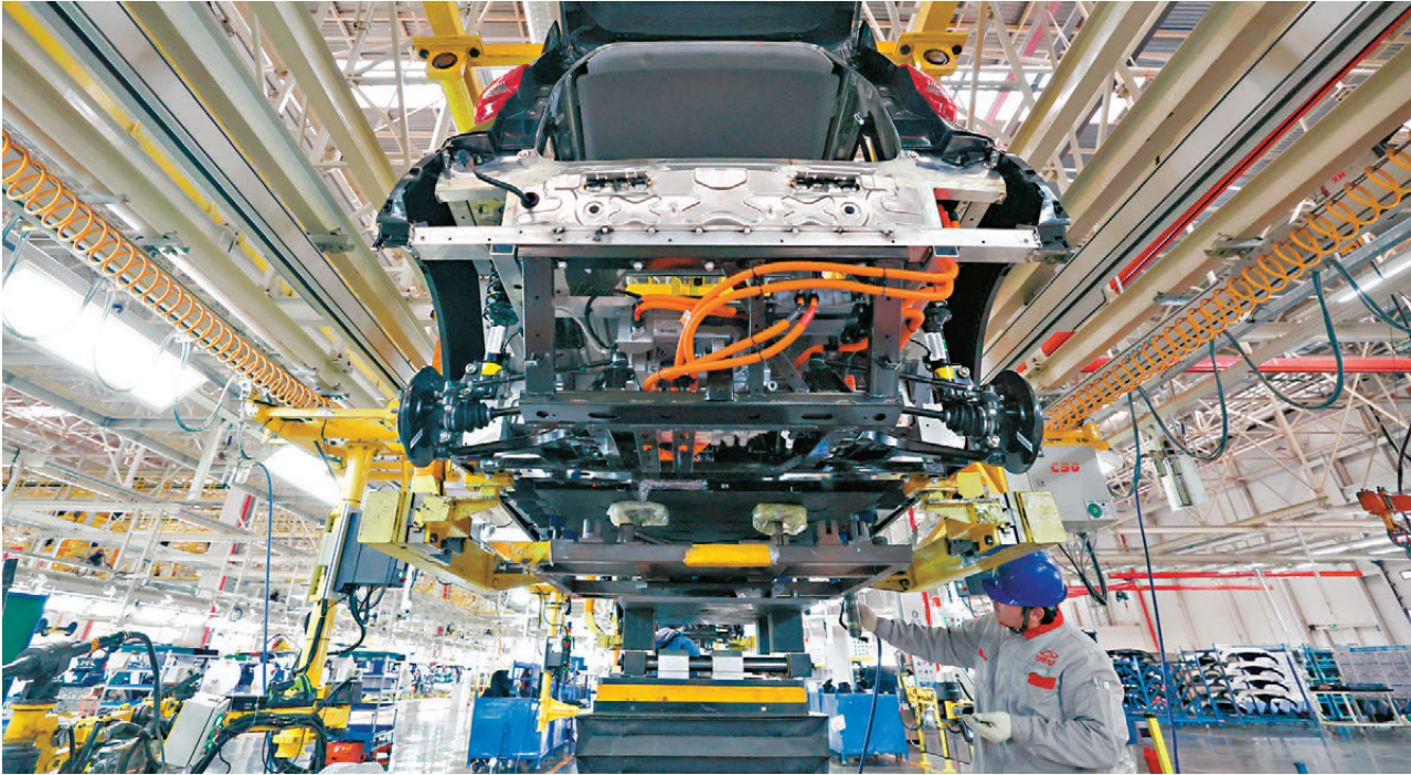
●何立峰在致辭中指出，中國不僅願做「世界工廠」，更願做「世界市場」。圖為奇瑞新能源汽車股份有限公司某總裝車間，員工在裝配新能源汽車。

何立峰表示，坦誠而言，世界各國社會制度不同，發展階段有別，歷史文化各異，發展和交流交往過程中難免會有一些分歧和摩擦，有時其實只是誤解。關鍵是要秉持平等、尊重、互惠的態度，堅持以對話增互信，以磋商解紛爭，不能從對抗、對立中找答案，而要在交流、協商中謀出路，探索雙贏多贏之道。中國是各國的貿易夥伴而不是對手，中國的發展是對世界經濟發展的機遇而不是威脅。對於國際經貿合作中出現的一些分歧和誤解，中國倡導通過平等協商，增進互信，彌合分歧，解決問題。