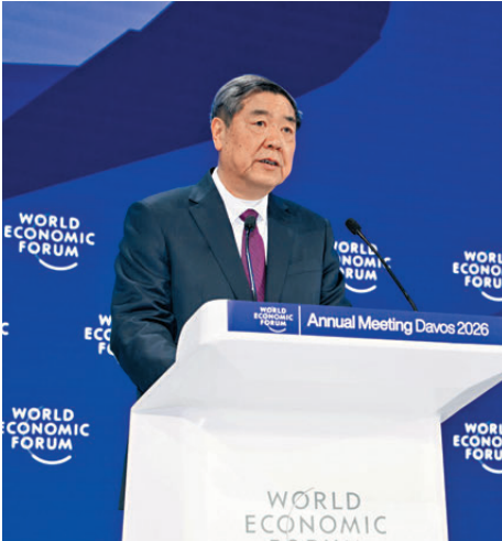
●1月20日，中共中央政治局委員、國務院副總理何立峰在瑞士達沃斯出席世界經濟論壇2026年年會並發表致辭。

何立峰進一步指出，當前，多邊貿易體制面臨多年未有的嚴峻挑戰，一些國家的單邊做法和貿易協議明顯違反世貿組織基本原則和規則，嚴重衝擊國際經貿秩序。多邊主義是維護國際秩序穩定，促進人類發展進步的人間正道。規則面前應當「人人平等」，極少數國家不應有基於實力的「特權」，世界不能重回弱肉強食的「叢