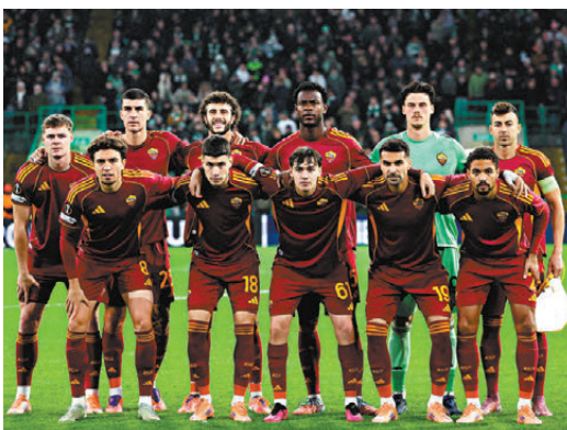
●羅馬主場威力不俗。

分組「二哥」米迪蘭特同時間將造訪白蘭恩（香港時間周五1：45a.m.開賽）。米迪蘭特上場分組賽勇挫亨克，論級數必在上輪主場四球淨負費倫巴治的白蘭恩之上，預料作客仍有力言勝。