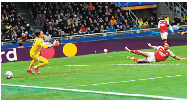
●加比爾捷西斯（右）是役攻入兩球。