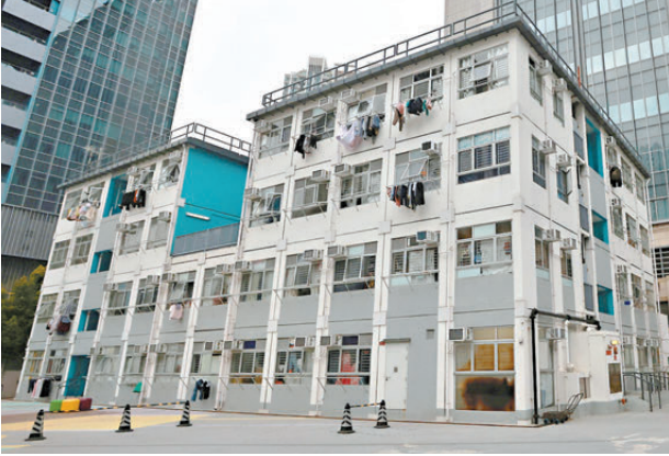
●長沙灣過渡性房屋「喜信」。

最後，她向記者分享，雖然過渡性房屋是短期改善居住條件的選擇，但自己慢慢有一種終於「捱」出頭的感覺，「我們申請的公屋，前段時間也有了進度，已經見了主任，希望能盡快上樓。」