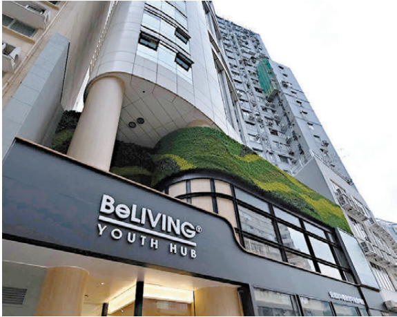
●位於銅鑼灣摩理臣山道青年宿舍「BeLIVING Youth Hub」。

香港文匯報訊（記者 李千尋）位於銅鑼灣摩理臣山道青年宿舍「BeLIVING Youth Hub」原預期營運至 2028 年，但上周一有住戶被通知需於下月 28 日前遷出。宿舍營運方香港青年聯會昨日表示，項目所涉租約將於下月 28 日屆滿，已立即通知住戶盡快