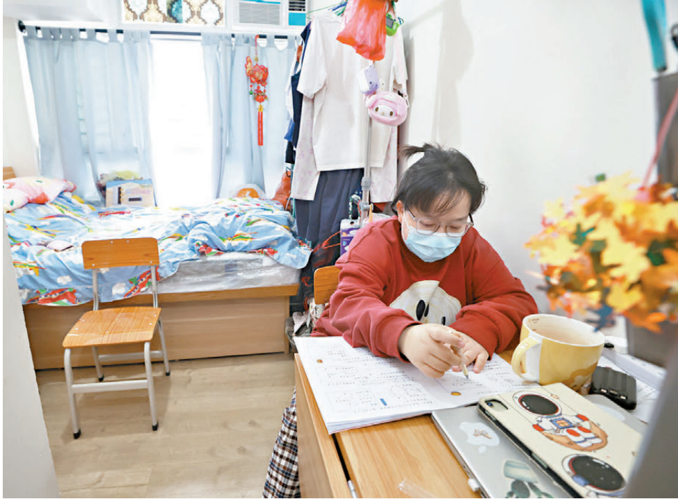
●余女士與女兒的家雖不算大，但布置簡單而溫馨，相較過去住劊房時，女兒終於可以正正經經坐在書枱前溫書做功課了。