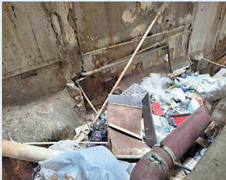
●深水埗區舊樓劊房環境惡劣，處處藏着消防隱患，與明亮的過渡房有天淵之別。