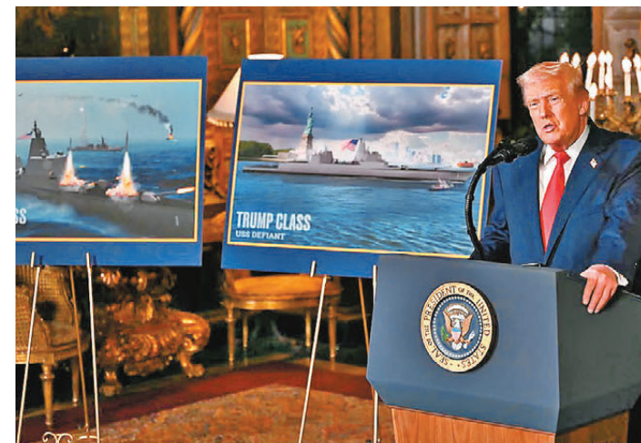
●特朗普在佛羅里達州海湖莊園宣布美國海軍新的「黃金艦隊」計劃。

特朗普政府不公開宣戰，更在未獲得授權下，突襲委內瑞拉，強行控制一個主權國家的民選總統，本質上就是美國霸權主義「炮艦外交」的回歸。何況當下「炮艦外交」目的並非佔領領土，而是達成在華盛頓設定的框架內進行治理。