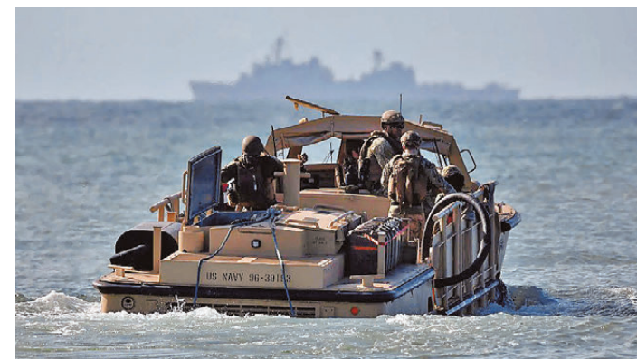
●2025年12月，美國海軍在加勒比地區搞軍事集結。網上圖片