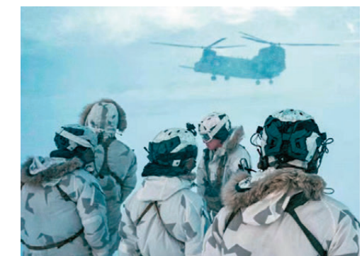
●美國吹噓其特種部隊比以往任何時候都更具殺傷力，行事更隱秘。

如今，「炮艦外交」有了變異或升級，但攻城略地的登陸戰、地面戰已行不通，一是相比全面戰爭，「炮艦外交」用更少的資源，實現不對稱降維打擊，避免巨大人員傷亡；二是美國國力已承受不起攻城