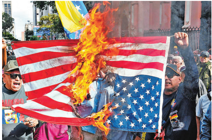
●1月3日，美軍強行控制委內瑞拉總統馬杜羅及其妻子後，委內瑞拉政府支持者在加拉加斯焚燒美國國旗。網上圖片

戰略》提出所謂的「門羅主義的特朗普修正案」(Trump Corollary to the Monroe Doctrine)。所謂門羅主義是美國在1823年由總統詹姆斯·門羅提出的外交政策，核心原則是「美洲是美洲人的美洲」。而「門羅主義的特朗普修正案」明確授權使用武力，「恢復美國在西半球的霸權地位」。這表明，美國「炮艦外交」的背後邏輯從未消失，「炮艦外交」理念再次抬頭。