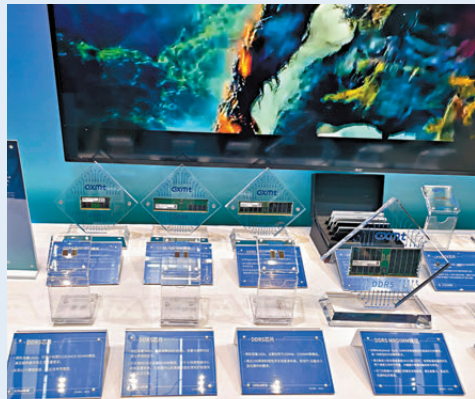
●全球前5000個品牌中，中國品牌價值1.81萬億美元居全球第二。圖為中國企業生產的芯片。

據介紹，截至2025年底，國內（不含港澳台）發明專利有效量達到532萬件，每萬人口高價值發明專利擁有量達到16件。專利密集型產業增加值佔GDP比重升至2024年的13.38%，超額完成知識產權「十四五」規劃預期目標。截至2025年底，國內（不含港澳台）有效註冊商標量為4,987.7萬件。全球前5,000個品牌中，中國品牌價值達1.81萬億美元，位居全球第二。 截至2025年底，長三角地區、京津冀地區和廣東省的發明專利有效量分別為173.4萬件、91.6萬件和89.9萬件，合計約佔國內總量的三分之二；有效註冊商標量合計2,805.8萬件，佔國內總量的一半以上。在世界知識產權組織發布的2025年全球百強創新集群排名中，深圳—香港—廣州、北