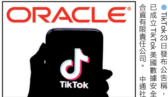
●TikTok 23日發布公告稱，已成立TikTok美國數據安全合資有限責任公司。 中通訊社

周密指出，美國市場是TikTok全球布局中的關鍵板塊，在其整體生態中具有特殊價值與突出貢獻，該市場的穩定運營與持續發展，料將為TikTok全球業務增長提供有力支撐；同時也能保障美國用戶原有使用情況的延續性，既契合美國消費者對差異化數字服務的需求，也有利於美國數字經濟相關服務的穩定供給。另值得注意的是，這一解決方案也為中美雙方妥善處理未來可能出現的經貿矛盾與分歧，提供了可借鑒的實踐範例。