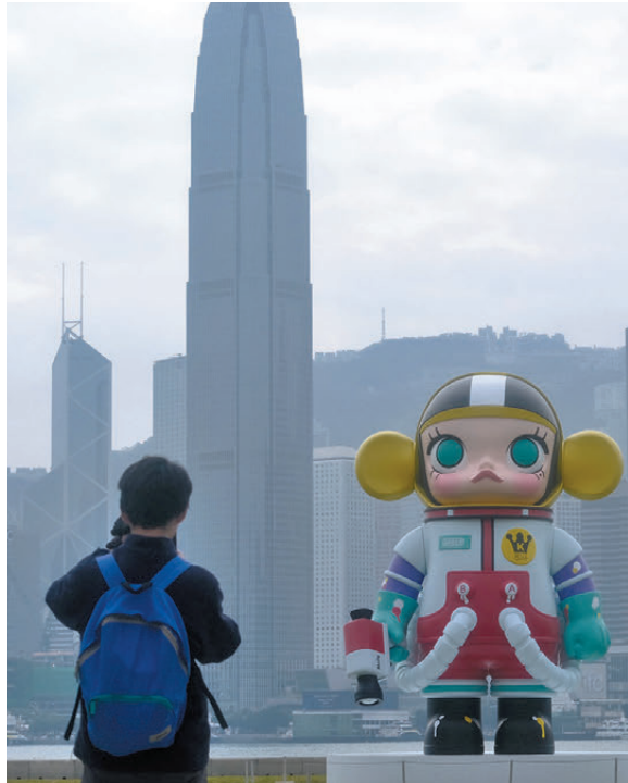
●「倔強少女」MOLLY 像所有咬牙堅持的人一樣固執而溫柔。圖為 6 米高 SPACE MOLLY 大型雕塑。