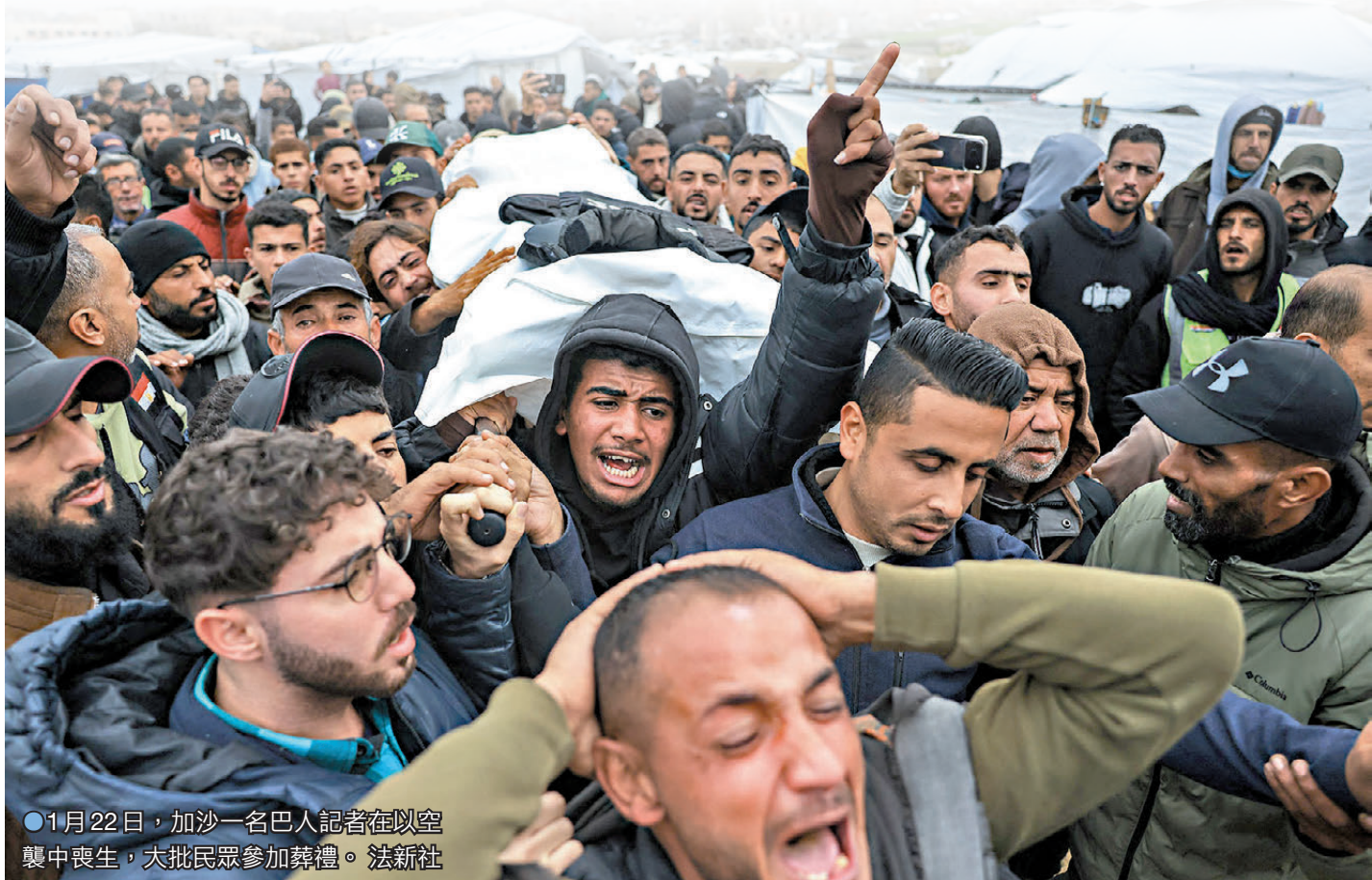
●1月22日，加沙一名巴人記者在以空襲中喪生，大批民眾參加葬禮。

特朗普主持「和平委員會」簽署儀式時稱，世界較一年前「更富裕、更安全、更和平」。該委員會最初被提出作為促成加沙停火的一部分，但特朗普其後暗示它可能擔當更廣泛的地緣政治角色。被問及此新機構會否取代聯合國時，特朗普回應「有可能」。他聲稱共有59個國家及地區同意加入，但今次簽署儀式只有來自阿根廷、匈牙利、印尼、約旦、哈薩克斯坦、科索沃、摩洛哥等19國代表出席。