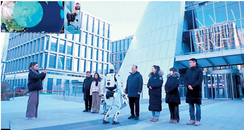
●「天工」將項目竣工證轉交給建設方，這是全球首次具身智能人形機器人成功連接低軌衛星。