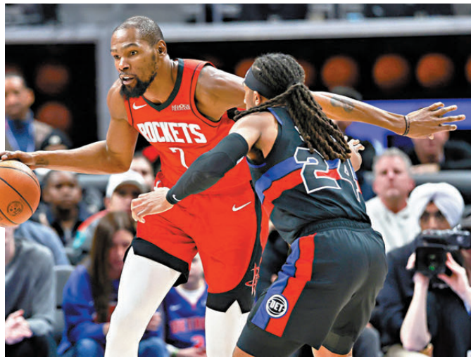
●杜蘭特（紅衫）在對活塞一戰，射入生涯第2,283記三分球。

至於積分榜第五的祖雲達斯將在香港時間周一凌晨主場對「三哥」拿玻里。祖雲達斯近況回勇，僅錄兩場敗仗，與拿玻里並列意甲主場不败雙雄，前者主場近14戰10勝，自去年三月以來主場不败。進攻核心基蘭耶迪斯本季意甲20場貢獻七入球、四助攻，包括上月對拿玻里的入球，已追平上季全年數據，成今仗致勝關鍵人物。干地率領的拿玻里氣勢回勇，但14次聯賽作客祖記僅贏兩場，且干地本人從未在意甲主場擊敗老東家。前鋒海倫上月對祖記梅開二度，但近五場聯賽顆粒無收，需找回狀態破門。（Now638台周一凌晨1：00a.m.直播）