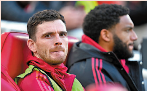
●傳安德魯羅拔臣將交易至熱刺。 資料圖片

香港文匯報訊（記者 郭正謙）曾經叱咤英超的利物浦雙閘阿歷山大阿諾特及安德魯羅拔臣今季雙雙陷入困境，據報前者被皇家馬德里新任主帥艾比路亞明言棄用，而後者則極大機會在冬季轉會窗轉投熱刺，這對昔日「最強雙閘」已逐漸走下神壇。阿歷山大阿諾特及安德魯羅拔臣曾被喻為利物浦最強雙閘，助攻能力冠絕英超，不過兩人今季同樣陷入低谷。阿歷山大阿諾特拒絕續約紅軍而轉投皇馬後，一直受到傷患困擾，復出後亦未能站穩正選，至今僅上陣16場，有西班牙媒體報道皇馬新帥艾比路亞上任後曾與阿歷山大阿諾特有過一次坦率對話，明言這位英格蘭右閘不在球隊計劃之中，建議他為了自己生涯着想於夏天主動離隊。至於阿諾特昔日好拍檔羅拔臣亦可能