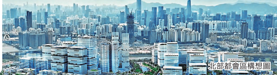
北都都會區構想圖