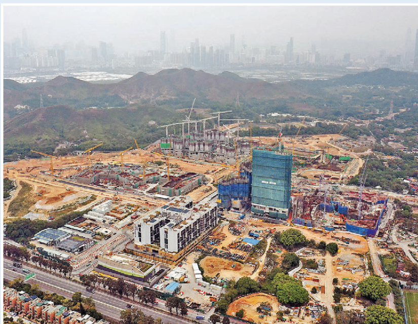
●古洞北新發展區工程。

規劃署及地政總署同樣地設立上述三層機制，其中地政總署的機制套用於各類土地交易申請，包括契約修訂、換地等的審批流程。在第三層的監察和介入機制下，發展局的兩個小組會定期舉行會議，處理個案和監察績效。林智文與部門代表早前已向土地及建設諮詢委員會轄下的精簡發展管制聯合小組委員會介紹有關措施，他指與會代表均表示支持。