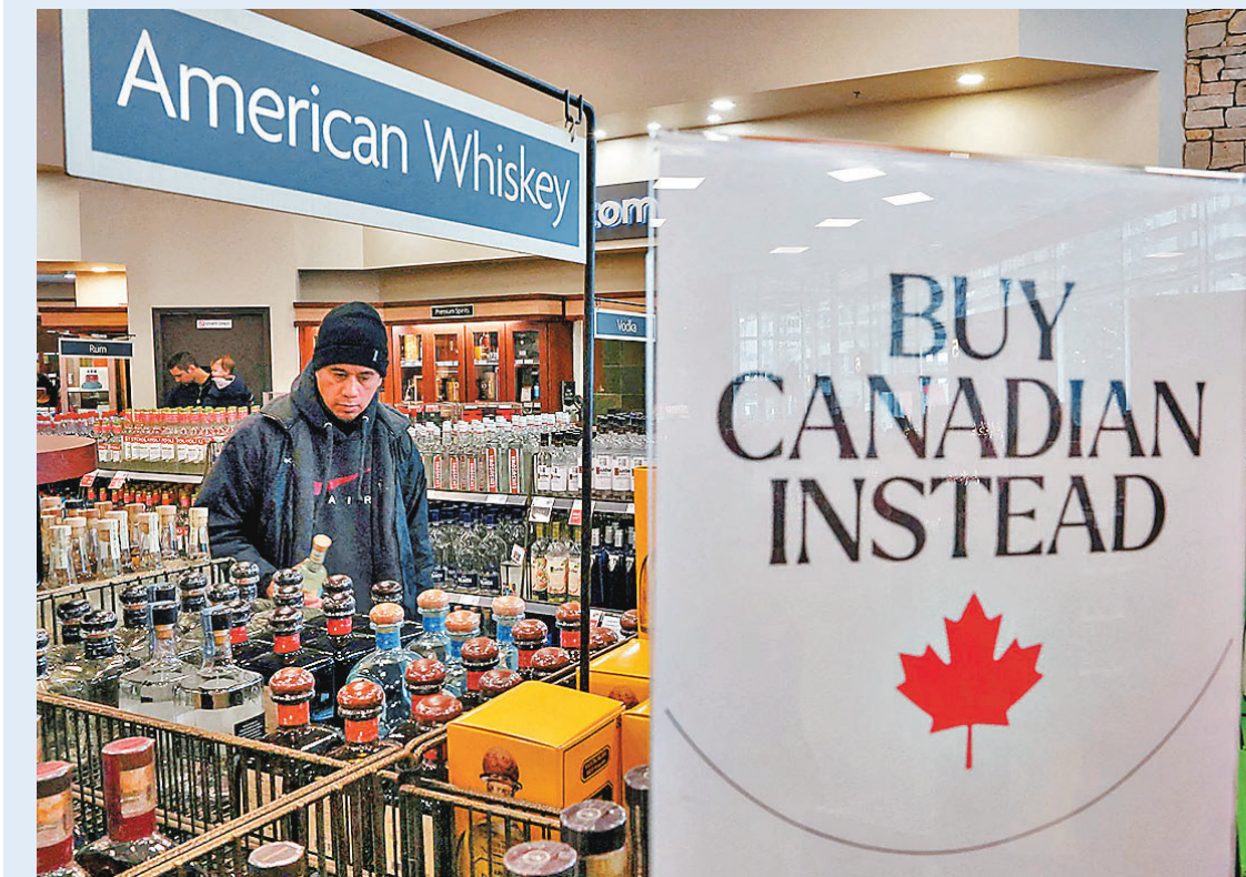
●卡尼鼓勵以本地產品建設國家。圖為加拿大商店去年曾下架部分美國商品，並標示請買加拿大物品。

此次貿易風波發生於達沃斯世界經濟論壇年會之後，兩國領導人在國際舞台上的言論已顯露分歧。卡尼在論壇演講中雖未直接點名美國，但直言「中等國家必須攜手合作，因為若你不在談判桌上，就會成為別人的盤中餐」，這言論被外界視為對美國單邊主義的批評。特朗普則在演說中稱加拿大「靠美國才能生存」，但這說法隨後遭卡尼駁斥，明確指出「加拿大並非依賴美國而生存，我們之所以繁榮，只因我們是加拿大人，我們是自己國家的主人」。 據加拿大廣播公司報道，儘管特朗普的威脅言辭激烈，但加國政府公開反應「相當淡定」。報道回顧指出，特朗普過去曾多次發出極端關稅威脅，不過部分最終並未實施，例如去年10月安大略省發布反對美國關稅的廣告後，特朗普宣布對加國加徵10%關稅，便未有成事。