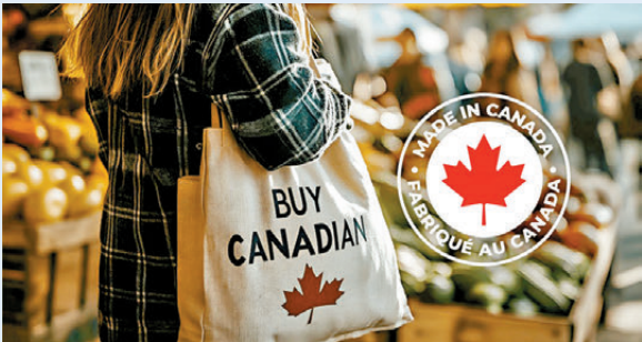
●加拿大政府在網上宣傳購買本地貨。