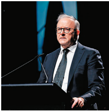
●阿爾巴尼斯稱讚卡尼日前有關中等國家應聯手對抗美國霸權的言論。

基於規則的全球秩序已破裂，各國應看清這一現實，一味順從霸權將無法保護自己免受大國侵略。 美國總統特朗普其後批評卡尼的言論，稱「加拿大是靠美國才能活下去」。阿爾巴尼斯則力挺卡尼，表示「我同意他的看法」，還透露「我的朋友卡尼將於3月來澳洲訪問，並於國會發表演說」。澳加兩國去年10月加強雙邊關係，雙方簽署協議，在關鍵性礦產和貿易方面擴大合作。