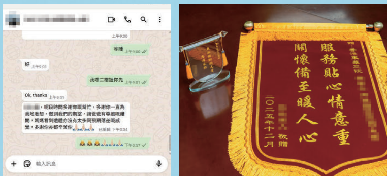
▲不少大埔災民接受東華三院支援後都深表感激，並送上感謝狀、錦旗或透過WhatsApp表達謝意。