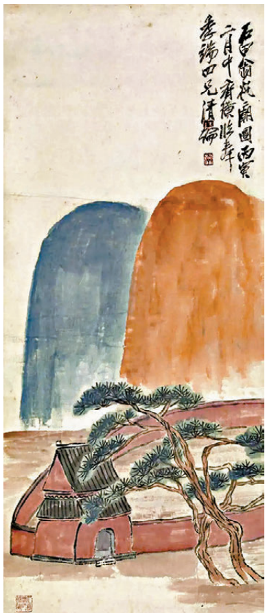
●多幅齊白石《岱廟圖》齊聚一堂。