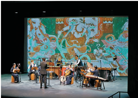
●香港天籟敦煌樂團八周年音樂巡禮「如願」音樂會演出現場。

齊白石曾言，藝術之道，要能謙，謙受益。不欲眼高手低，議論闊大，本事卑俗。有識如此數則，自然成器！本次展覽「白石門下」單元，聚焦齊白石與李苦禪、王雪濤、許麟廬等弟子的傳道與獨創，通過師徒作品的對比與弟子面貌的呈現，展示出守正創新的真意。 展覽現場，李苦禪的一幅《祭物圖》吸引了很多觀眾駐足。1926 年齊白石母親病逝，他因戰亂被困北京，沒能見到母親最後一面。他讓弟子李苦禪畫了豬和鴨子備燒，後因這幅圖畫得太好，齊白石沒捨得燒掉，還在畫上題了長跋，收在衣櫃的夾層裏，直至其去世後才被發現。這幅被齊白石「藏」起來的畫，亦成為他與李苦禪師徒情深的見證。 據北京畫院美術館藝術總監、齊白石藝術國際研究中心秘書長王亞楠介紹，除此次主題大展，作為「齊白石在山東」文旅融合創新項目的組成部分，還將在濟南市美術館、王雪濤紀念館、崔子范美術館、煙台市博物館同步推出李苦禪、王雪濤、許麟廬、崔子范的專題平行展，希望通過一個展溫暖一座城，聯動山東全省共同展示齊白石和弟子的溫情故事，系統呈現齊派藝術在山東的傳承脈絡與蓬勃生機。 ●文：香港文匯報記者 殷江宏、實習記者 趙填源 濟南報道