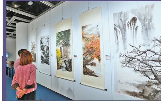
●「白雲傳承映香江」書畫展呈現 152 幅精心創作的書畫佳作。