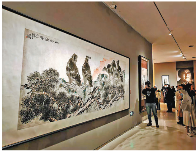
●李苦禪《山岳鍾英》

「學我者生——齊白石與山東弟子」特展早前在山東美術館亮相。本次展覽為期 4 個月，展品匯集了來自全國 6 省 7 市、11 家重要文物藝術機構的珍貴藏品 136 件，完整呈現了齊派藝術的形成、發展及在山東的薪傳。展覽首次系統發掘並展示了齊白石藝術與齊魯大地的深層文化聯結，以及眾多山東弟子對其畫風的承襲與發展，構建了一個跨越時空的藝術對話場。 作為山東地區聚焦齊白石及其藝術傳承的首次大規模公益展覽項目，本次展出的作品不僅包括齊白石的經典之作，亦涵蓋對其產生影響的李鱓、李方膺、高鳳翰、吳昌碩等前賢，以及深受其教誨的李苦禪、王雪濤、于非闇、許麟廬、崔子范等山東籍或與山東淵源深厚的名家力作，形成了獨具特色的傳承譜系。 山東省美術館館長楊曉剛表示，此次展覽設置三個單元。其中「古今可師」單元追溯齊白石博采眾長的藝術淵源；「我行我道」單元展現其融會貫通、自成一格的創造歷程；「白石門下」單元則重點梳理其藝術思想與風格在山東弟子中的接受與延續。 此外，展覽還精心呈現「萬竹山居」「五出五歸」「一花一世界」等數字光影場景沉浸體驗、「未來白石——少兒書畫作品展」及豐富的文創產品，進一步拉近傳統藝術與現代公眾的距離，實現了藝術教育、文化傳承與文旅體驗的有機融合。