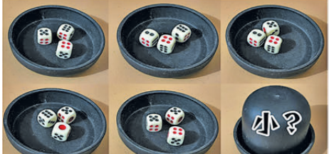
連續開5鋪「大」，嚟緊呢啲唔開「細」，我「批個頭落嚟畀你當發生」！ 「一筆還一筆」，鋪鋪都唔同㗎！你加大注碼我唔反對，翻身或者同呢度賭場啲大耳窿借錢好甘啱嚟落注，就好危險㗎！