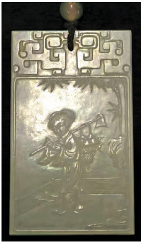
「嫦娥祝壽圖」子崗牌以和田玉為材。

將此牌與故宮館藏的明代子崗牌細緻比對，二者在材質、制式、工藝、紋飾、落款五大核心維度高度契合，均堅守「純潤至上」的選材原則，嚴循黃金分割的審美標準，展現出明代玉雕藝術的巔峰水平。這枚「嫦娥祝壽圖」子崗牌，是「玉德」與「文心」的完美融合，承載着明代文人的風骨與陸子崗的工匠精神，歷經400年時光流轉，依舊閃耀着中華傳統工藝的不朽魅力。