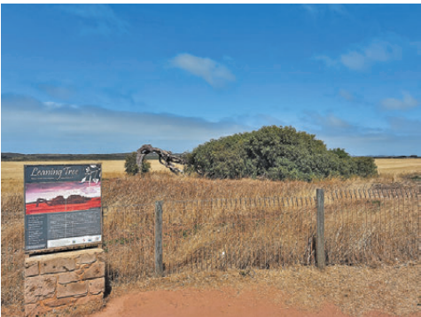
●一棵倒伏的樹，成了旅遊景點。

動物總是呆萌的，袋鼠在草地上慵懶着，考拉蜷縮在樹杈上睡覺，並不懼人。牛羊成群，在收割後一覽無餘的田地上悠閒地吃草。夜裏駕車要特別小心，袋鼠會迎着車燈撞上來。袋鼠奔跑速度極快，後果可想而知。看着高速路旁偶爾閃過的被撞死的袋鼠屍體，我諮詢當地人牠們為什麼會撞擊車燈，是不是因為對新事物好奇。回答令人莞爾：這裏的動物生存環境太好了，草地遼闊，食物豐富，又很少有