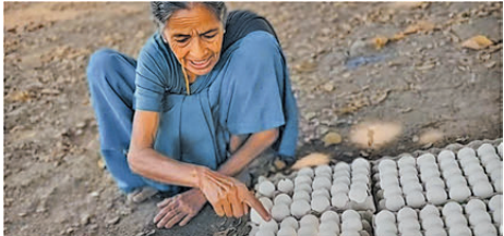
我年紀大，唔似得後生咁降，雞難蛋可以兩三隻一齊嚟，而家只可以「一隻還一隻」！