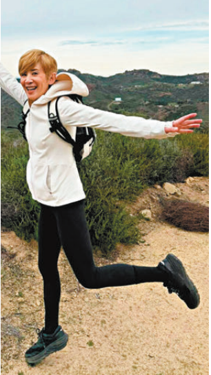
● 吳君如狀態甚佳。lg圖片

一身輕便裝束的君如，手持兩支攀山手杖挑戰六座山峰，當中有一座就是位於美國洛杉磯荷里活，裝設當地著名標誌「HOLLYWOOD」的李山，該山山頂附近有一個由石頭圍成的螺旋狀或迷宮狀圖案，不少行山遊客都會以此圖案為打卡背景。君如當然亦趁機打卡留念。