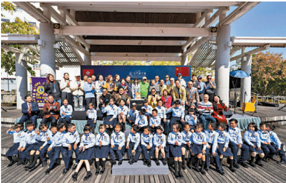
● 眾人齊為胡楓慶祝94歲生辰。

中感動地表示：「非常多謝大家為我慶祝生日，能夠有超過一千人為我唱生日歌，相信是今年最大型、最難忘的生日會。」他亦不忘祝福所有長者福壽安康、龍馬精神、笑口常開。