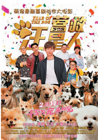
● 2月14日《營救汪星人》萌宠來襲。

香港文匯報訊（記者 馬曉芳）由梁婷編劇執導，成毅、文松領銜主演，周延（GAI）、林雪、歐弟等聯合演出的萌宠喜劇電影《營救汪星人》定檔2月14日情人節。作為內地春節檔唯一一部集萌宠、懸疑、動作、喜劇於一體的闖家歡電影，更創下華語影史最大規模「狗演員」參演紀錄，動員多達273隻訓練有素的「汪星人」演出，堪稱史上最大「狗界聯合國」。 影片圍繞退役警犬訓導員成斌（成毅飾）與功勳拉布拉多「大雄」展開。當街坊鄰居的愛犬一夜間集體失蹤，成毅和「大雄」踏上驚心動魄的營救之路，卻意外捲入犯罪團夥的陰謀，他們與機智勇敢的狗狗們並肩作戰，與犯罪團夥鬥智鬥勇，最終挫敗罪犯。 電影以成毅與拉布拉多犬「大雄」聯手識破迷局、挫敗陰謀為主軸，懸疑劇情中