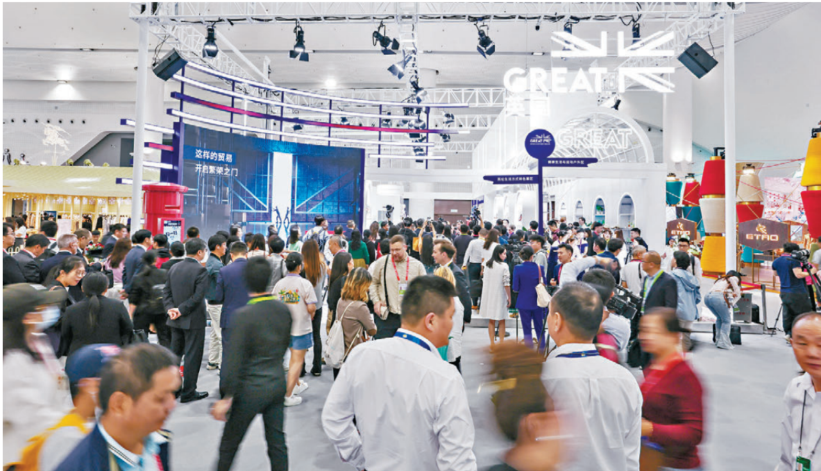
●英國首相訪華期間，商務部擬與英方簽署貿易投資合作方面成果文件，力爭打造中英經貿合作的新增長點。圖為早前，第五屆中國國際消費品博覽會上，主賓國英國國家館開館。

傅聰還說，中國是國際法治的堅定維護者。中方將同各國一道，積極推動構建人類命運共同體，為加強國際法治、促進世界和平與發展作出新的貢獻。