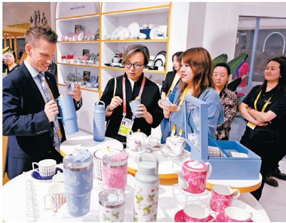
●早前，外方人員在海南海口舉行的第五屆消博會英國國家館內向參觀者介紹展品。