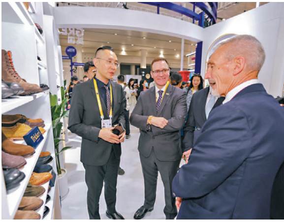
●早前，在第五屆消博會主賓國英國國家館內，嘉賓瀏覽英國品牌展品。

香港文匯報訊 據新華社報道，中國常駐聯合國代表傅聰26日在聯合國安理會國際法治公開辯論會上發言，敦促堅決捍衛《聯合國憲章》宗旨和原則、堅定維護國際法治的權威。