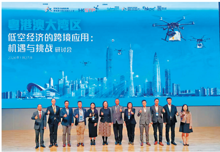
● 出席研討會的嘉賓均為發展跨境低空經濟點。