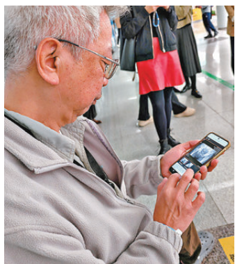
● 在香港大學深圳醫院，香港居民容先生正查看自己在該院拍攝的影片。