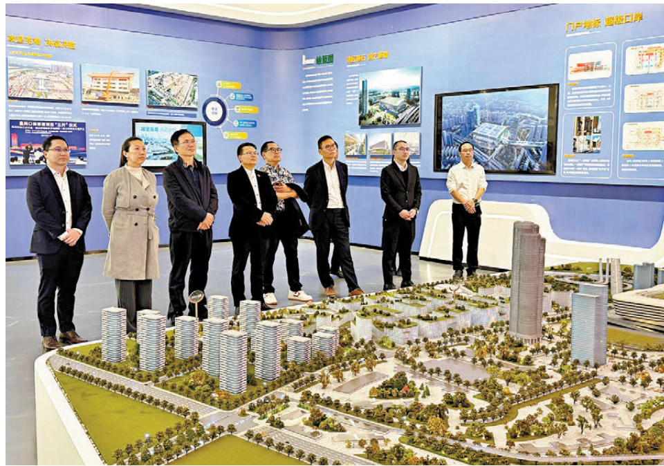
● 民建聯考察新皇崗口岸聯檢大樓施工進展，並到工程展覽廳參觀。