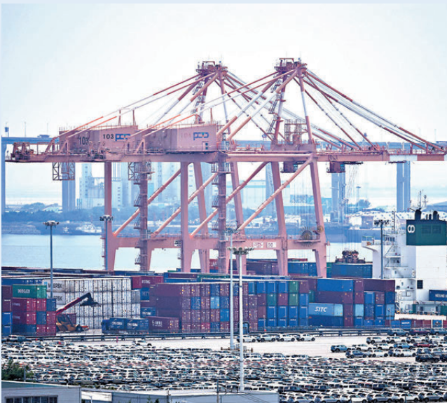
▲受關稅影響，韓國去年對美汽車出口額大減至301.5億美元。圖為韓國平澤市港口。