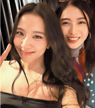
●甘比（右）與Jisoo合照。