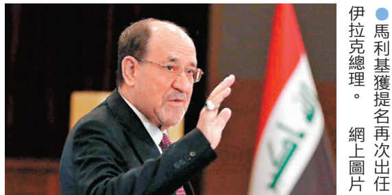
●馬利基獲提名再次出任伊拉克總理。 網上圖片

75歲的馬利基是什葉派政客，2006年至2014年連續兩屆出任伊拉克總理，現為「法治國家聯盟」領導人。馬利基最初曾得到美國前總統布什政府支持，但美國後來對馬利基的態度急轉直下，美官員指責他煽動教派矛盾，推行「獨裁政策」。2014年，極端組織「伊斯蘭國」（ISIS）武裝分子大舉入侵伊拉克並攻佔第二大城市摩蘇爾後，時任美總統奧巴馬政府聲稱馬利基必須卸任，美國才承諾協助伊軍方擊退極端分子。