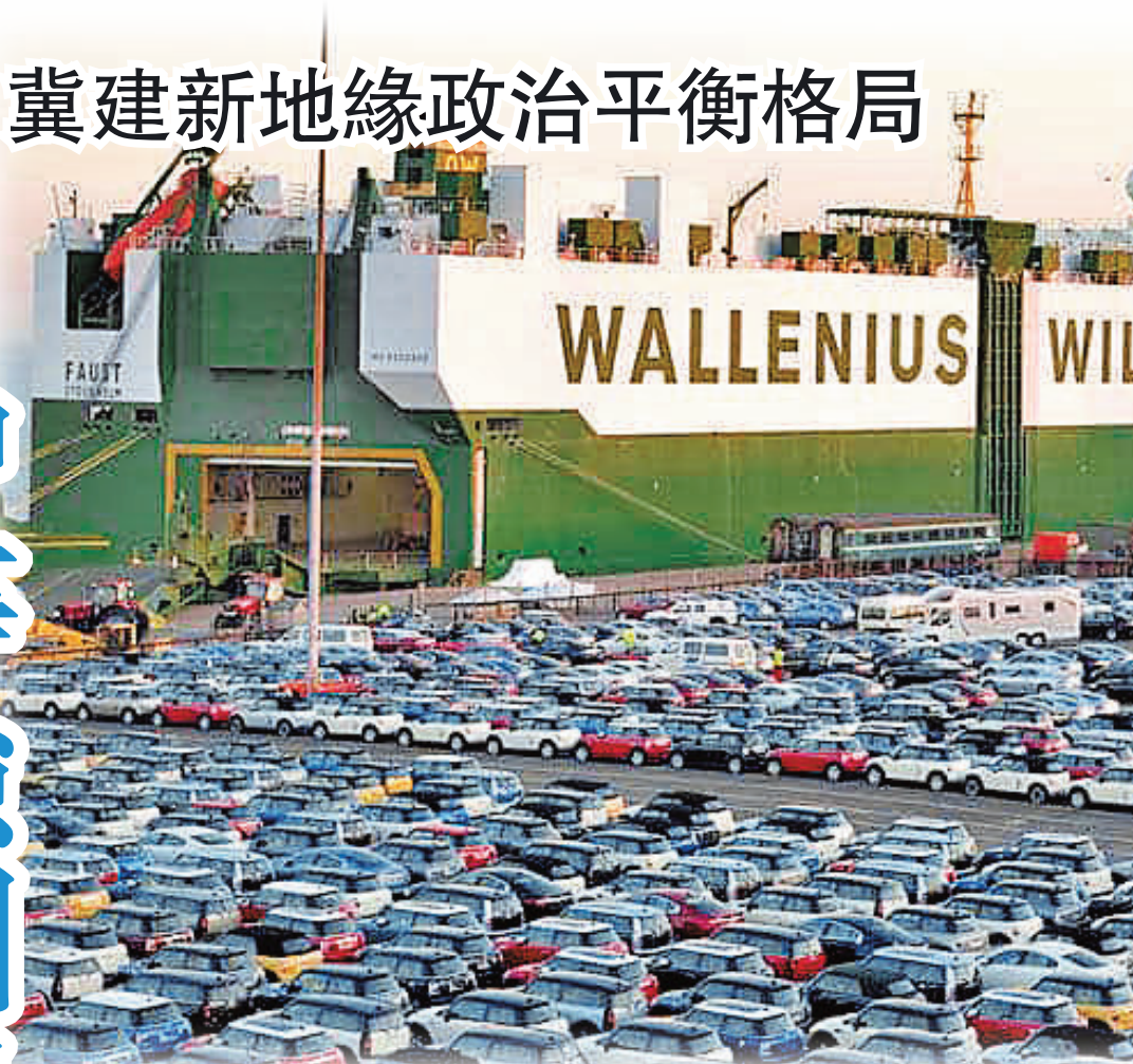
●印度同意削減歐洲汽車的進口關稅。圖為大量汽車停泊在德國港口。