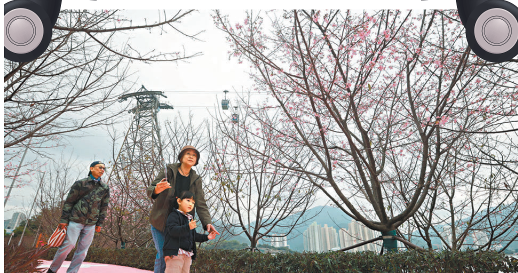
●香港機場櫻花園開放。