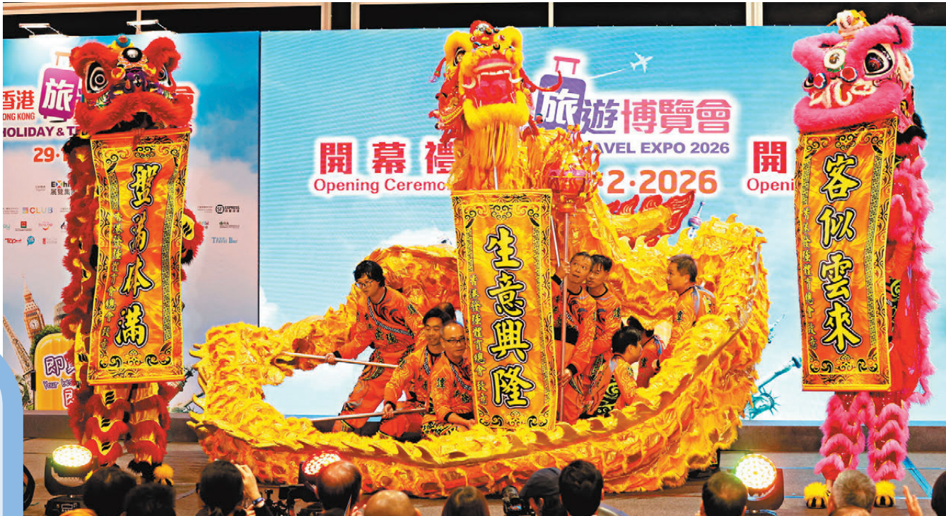
▼表演者身穿民族服裝吸客。