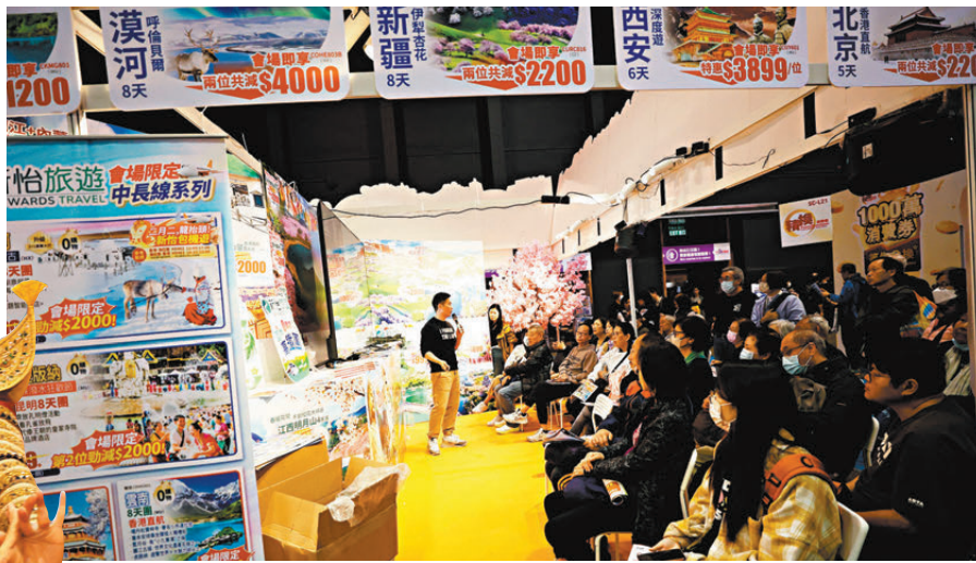
▲市民參加旅遊講座了解特色旅遊產品。

由展覽集團主辦、香港旅遊業協會協辦的「香港旅遊博覽會2026」，昨日起一連4天於香港會議展覽中心舉行，匯聚逾40間旅行社及郵輪公司，合共提供逾200條旅遊路線優惠，今屆更新互動遊戲「推鴨王大賽」，部分旅行社攤位長期排滿人龍，不少入場人士指場內優惠吸引，有香港度假酒店表示今年推出999元的全年套票與799元美食套票，折扣低至兩折。特區政府文化體育及旅遊局局長羅淑佩致辭時表示，今年是國家「十五五」規劃的開局之年，該局會與業界充分善用中央各項惠港政策，將香港打造成為旅客「樂而忘返、念念不忘、一來再來」的世界旅遊目的地，隨着機場三跑系統正式投入服務，2025年航班數量已大幅回復，展望今年，機場航班會再錄得升幅。