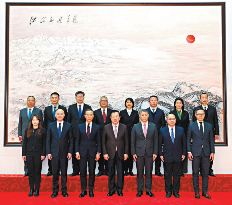
一行。夏寶龍會見澳門特區政府保安司司長陳子勁一行。