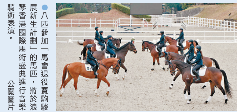
●八匹參加「馬會退役賽駒展新計劃」的馬匹，將於浪琴香港國際馬術盛典進行音樂表演。

香港文匯報訊「M」品牌國際體育盛事浪琴香港國際馬術盛典，今日(1月30日)起一連三天在亞洲國際博覽館盛大上演，呈獻世界級場地障礙賽及馬術表演。香港賽馬會作為策略夥伴將全力支持盛典，包括為馬術賽事提供全面的技術及後勤支援。馬術講求「人馬合一」，馬會祝盛典為馬年系列活動的「頭炮」，藉此頌讚這份人馬之間的深厚情誼。