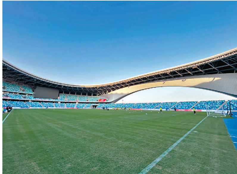
●近年粵港澳地區新建和改造了一批頂級專業足球場。圖為廣州南沙的大灣區文化體育中心體育場。 香港文匯報記者敖敏輝 攝

2026年是世界盃年，2030年第24屆世界盃(西班牙、摩洛哥等國)和2034年第25屆世界盃(沙特阿拉伯)主辦國均已塵埃落定。根據國際足聯現有政策，一屆世界盃的申辦國家不能來自過去兩屆世界盃的舉辦地所在大洲。由於沙特是亞洲國家，意味着中國將不能承辦2038年、2042年兩屆世界盃，即最早只能申辦2046年世界盃。