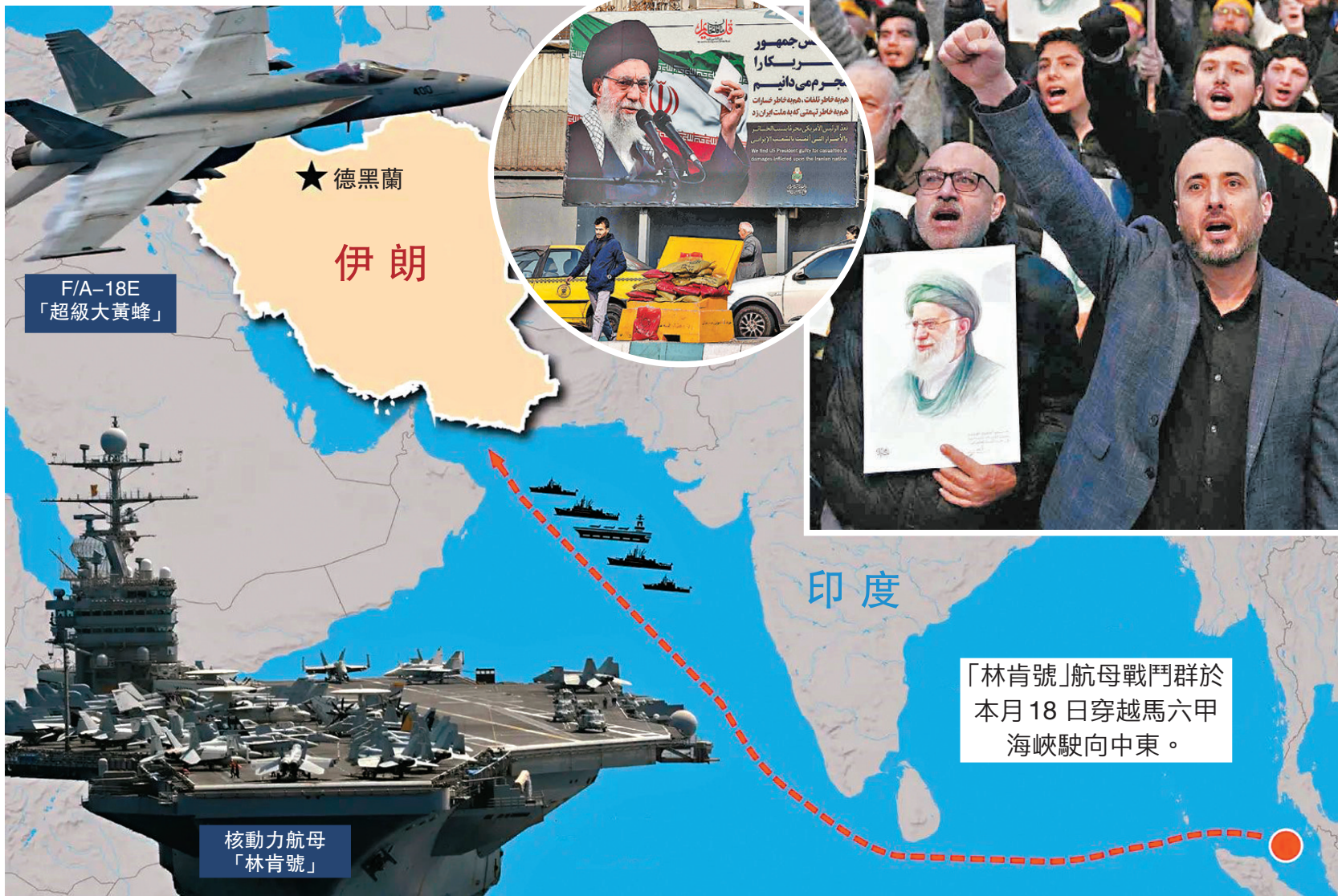
▲真主黨支持者在黎巴嫩貝魯特舉行支持伊朗集會。

伊朗外長阿拉格齊周三警告，伊朗武裝部隊已做好準備：「我們英勇的武裝部隊會隨時扣動扳機，對任何針對我們摯愛的陸地、空中和海洋的侵略行為做出強力回應。與此同時，伊朗始終歡迎互利共贏、公平公正的核協議，在平等的基礎上不受脅迫、威脅和恐嚇。該協議應確保伊朗享有和平利用核技術的權利。」