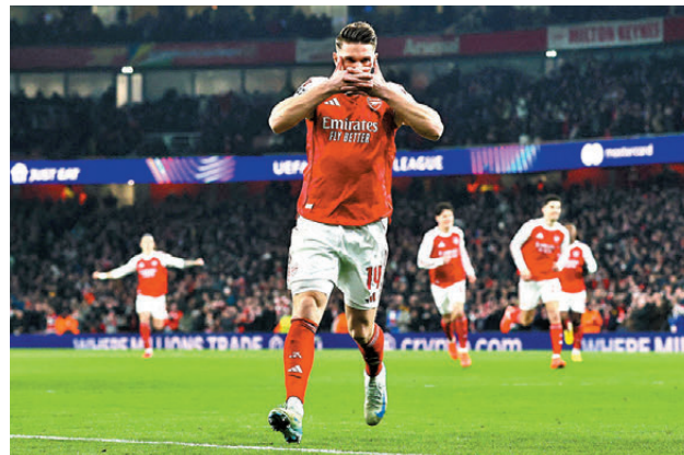
●阿仙奴主場擊敗卡拉特，以全勝姿態晉級。

英超領風騷 五隊直入歐聯16強 香港文匯報訊（記者 郭正謙）歐聯首階段成英超球隊天下，六支英超代表中有五隊躋身前八直入16強，其中阿仙奴更以八戰全勝佳績晉級，穩居歐洲第一聯賽寶座。 阿仙奴全勝晉級 賽前已篤定出線的阿仙奴，今場對哈薩克球隊卡拉特雖然收起不少主力，但仍憑藉約基里斯、夏維斯及加比爾馬天利尼上半場連入三球，以3：2力克對手，以全勝佳績晉身16強，並以一場勝利慶祝主帥阿迪達領軍第200場。阿迪達大讚球隊能夠以全勝姿態完成歐聯首階段是了不起的成就，認為有助阿仙奴繼續向冠軍邁進：「我們以自己的方式完成了歐聯首階段賽事，不用額外踢兩場附加賽，16強亦可將主場放在次回合，絕對是優勢，有助球隊爭標。」 至於利物浦則以6：0大破卡拉巴克，以第三名出線16強，四大攻擊手艾基迪基、域斯、穆罕默德沙拿及費達歷高基艾沙均有入球，而中場阿歷斯麥阿里士打則梅開二度，相信今場大勝有助提升球隊返回英超賽場後的信心。 另外，曼城、熱刺及車路士均在首階段煞科戰順利贏波直入16強。唯有紐卡素作客上屆歐聯盟主巴黎聖日耳門踢成1：1，只排第12位，需落入附加賽爭取16強席位。