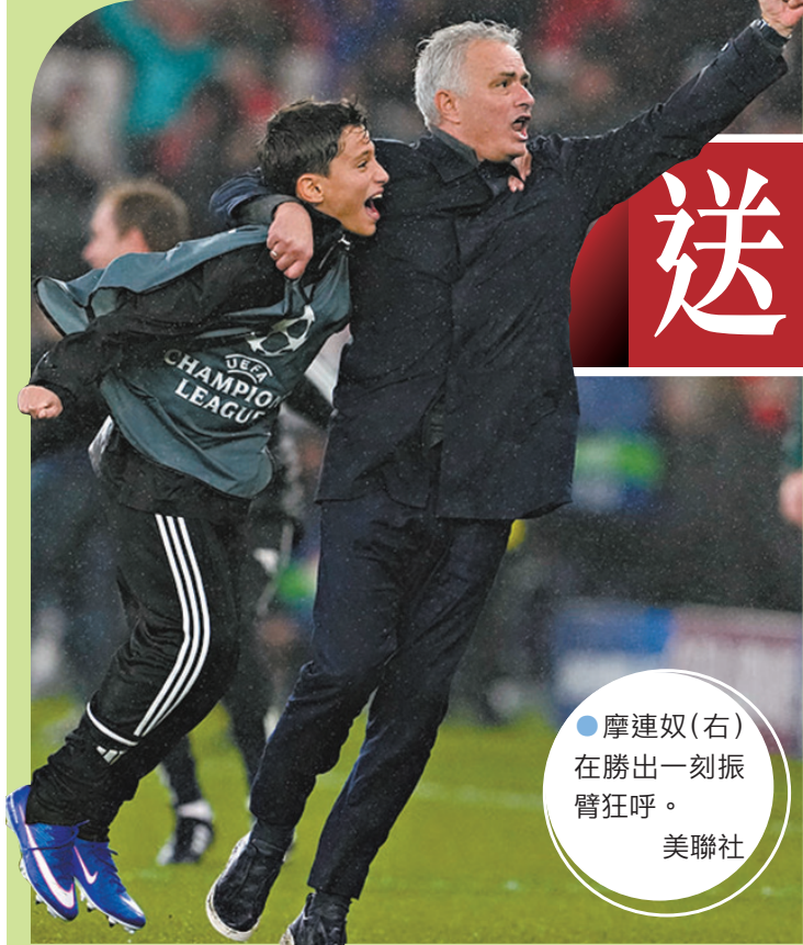
●摩連奴（右）在勝出刻振臂狂呼。