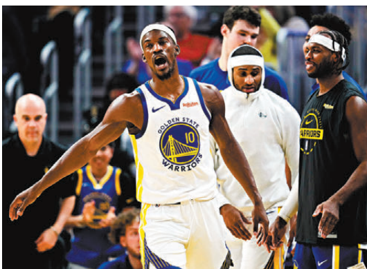
◀「字母哥」阿迪圖昆保決意在交易截止日前離開公鹿。資料圖片 ▲有傳勇士擬送出占美畢拿（白衫10號）及古明加，作為交換字母哥的籌碼。資料圖片

香港文匯報訊（記者 郭正謙）NBA交易截止日前或再出現震撼消息！有美媒報道公鹿主將「字母哥」阿迪圖昆保決意離隊，並準備好在交易截止日前尋找新東家，勇士、熱火、紐約人以及木狼等球隊均已提出報價，而公鹿方面則在認真考慮當中。 「字母哥」阿迪圖昆保在2013年在選秀大會被公鹿以首輪第15順位選中後便一直效力至今，曾兩奪常規賽MVP及一次總決賽MVP的他，於2021年助公鹿相隔50年再奪NBA總冠軍，目前也是隊史多項紀錄包括出場次數、得分、籃板、助攻及封阻的保持者，不過公鹿近年成績每況愈下，連續三年季後賽一輪遊，今季更只名列東岸12位，隨時無緣季後賽，