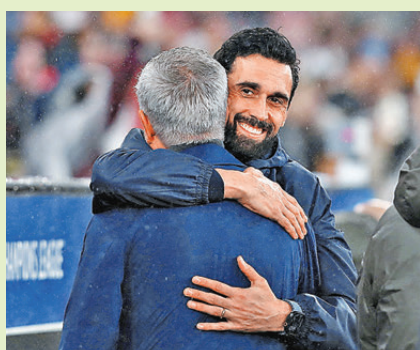
●皇馬主帥艾比路亞（後）賽後祝賀摩連奴。

皇馬守衛，將皮球狠狠頂入網，領賓菲加以4：2擊敗皇馬，以一個得失球之差，力壓同分的馬賽和帕福斯，位列第24名，搶得16強附加賽最後一席；還將皇馬踢出前八，跌入晉級附加賽。 領軍倒戈擊敗皇馬，摩連奴賽後難掩興奮：「我那麼激動好正常，賓菲加值得出線。擊敗皇馬是莫大榮耀，我換人時以為已經夠入球出線，但後來才知道還差一球。值得慶幸的是，我們捉緊了這個機會，杜魯賓攻入了一個歷史性的入球，主場好似興奮到會崩潰，實在太神奇！」 贏波功臣門將杜魯賓在最後一刻頂入石破天驚的致勝球，讓全球球迷和媒體陷入瘋狂。除著名評述員伊恩達克大讚摩連奴「再次施展魔法」，體育記者馬克洛馬斯寫道：「我剛在里斯本見證了什麼？小組賽的最後一腳，賓菲加門將杜魯賓將摩連奴的球隊送到淘汰賽。光明球場的場面太瘋狂了！」這場高潮迭起、戲劇性的一戰，不少網民亦讚嘆：「這就是我們喜歡足球的原因。」 隨着賓菲加以第24名出線，附加賽有一半機會再對皇馬，另一支可能對手是國際米蘭，意味摩連奴肯定再次倒戈。