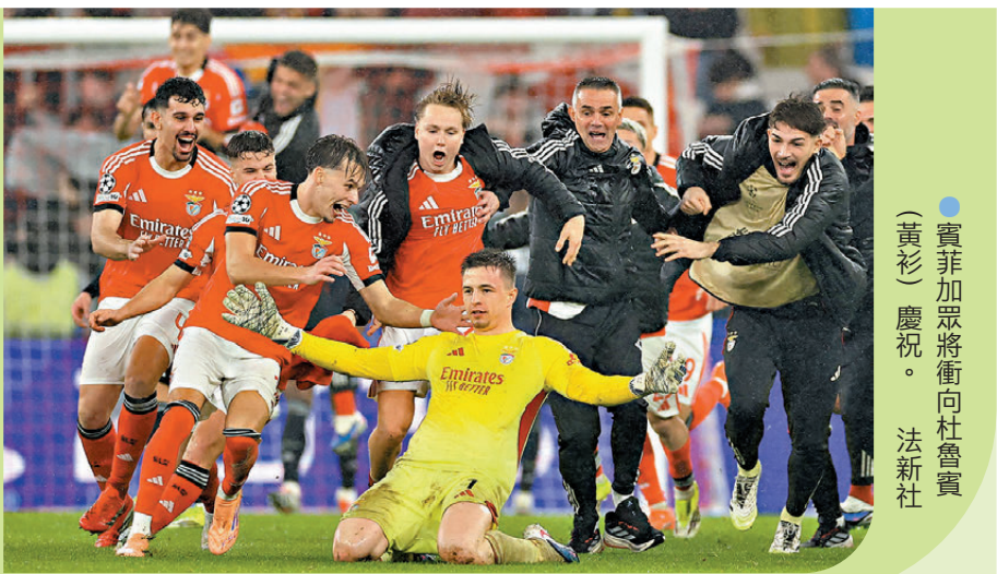
●賓菲加眾將衝向杜魯賓（黃衫）慶祝。

賓菲加今季的歐聯之路相當艱難，首四輪全敗，甚至在主場不敵來自阿塞拜疆的卡拉巴克，隨後主帥般奴拿治被解僱，摩連奴去年9月接手，時隔四分一世紀重返賓菲加執教，亦是他自從2004年離開波圖以來，首次重返葡萄牙領軍。從英超、西甲及歐聯冠軍，到近年流落土耳其後，這位63歲名帥看似從頂級神壇逐漸滑落，然而他在今仗作出「神指揮」，力證自己仍然是意氣昂揚的「Special One」。 即使在摩連奴接手賓菲加後，球隊四輪過後仍未得分，聯賽階段最後一輪前在36隊中排第29，還要面對曾執教的皇家馬德里，除了必須全取三分，還要盡量爭取入球，出線看來非常渺茫。 今場決戰高潮迭起，由基利安麥巴比率先為皇馬打開紀錄，賓菲加6分鐘後由舒捷爾達魯普追平，並在上半場補時5分鐘獲得十二碼，由柏夫利迪斯操刀中鵠，半場反超2：1。 另一邊廂的半場，馬賽作客0：2落後布魯日，賓菲加要出線仍需要多入兩球。換邊後，舒捷爾達魯普在54分鐘再下一城，此時賓菲加得失球仍未足以出線，4分鐘後麥巴比