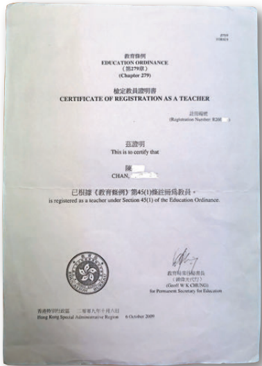
●持有有效的檢定教員證明書是申請教師執業證書的六大條件之一。

教育局將會制訂申請執業證書的指引，供申請人及學校了解申請程序、所需文件、申請費用、審批時間及結果通知方式等事宜；亦會制訂載有教師姓名及執業證書編號的教員登記冊。