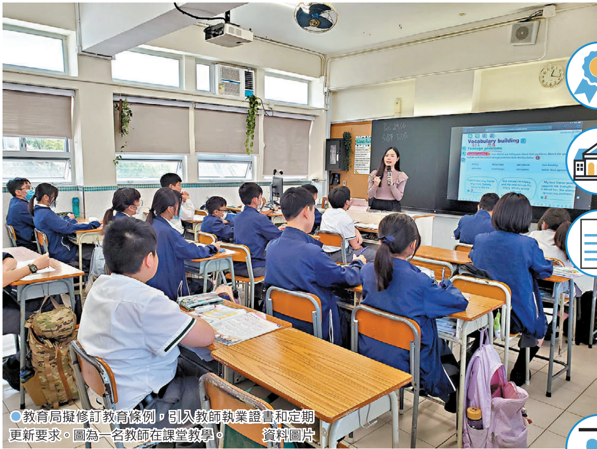
●教育局擬修訂《教育條例》，引入教師執業證書和定期更新要求。圖為一名教師在課堂教學。資料圖片

立法會教育事務委員會將於下周五討論修訂《教育條例》（簡稱《條例》）。教育局表示，已開展修訂《條例》的工作，並會繼續諮詢律政司的意見，以敲定修訂法例條文的內容，擬於今年下半年把修訂條例草案提交立法會審議。